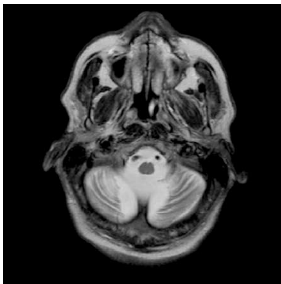
FIGUUR 1 MRI-opname van het cerebrum van patiënt A ( T_2 -gewogen transversale opname): cerebellaire atrofie gekenmerkt door verwijding van de foliae en toename van de omringende liquorruimte

de CT-scan van het abdomen, waarop een splenomegalie en vergrote, aankleurende lymfeklieren retroperitoneaal en para-aortaal te zien waren. Uiteindelijk bevestigde, na ruim 20 weken, een tweede excisiebiopt van een retroperitoneale klier de diagnose ziekte van Hodgkin (nodulair-scleroserende type). Er werd direct gestart met chemotherapie (adriamycine, bleomycine, vinblastine en dacarbazine) in combinatie met i.v. immunoglobulines. Hierop kwam de ziekte van Hodgkin in complete remissie. Echter, patiënt moest in een verpleeghuis worden opgenomen wegens persisterend ernstig cerebellair syndroom.