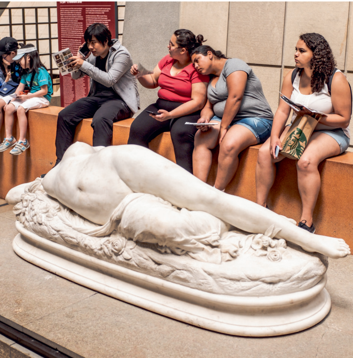
Parijs – Frankrijk (Joost de Wert, 2018)