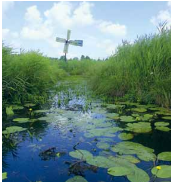
verlandend petgat in de Weerribben.