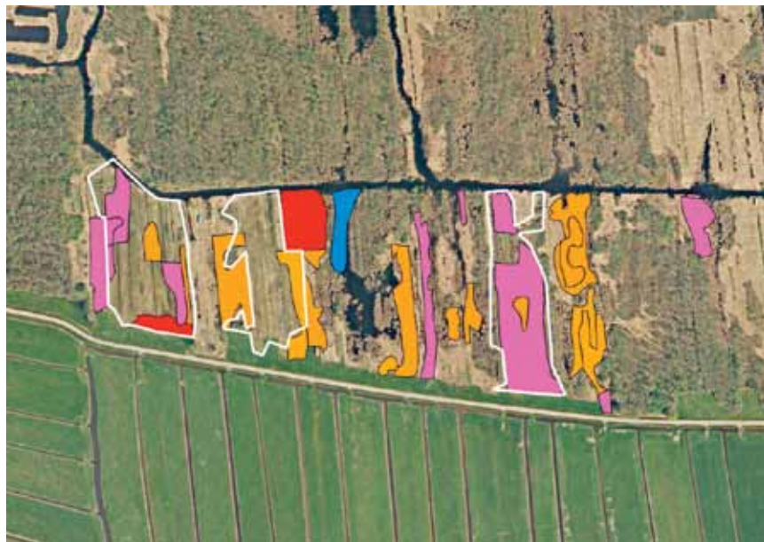
Figure 2 the effect of deforestation – 7 years after the intervention on 3 plots (white outlines) in the southwestern part of de Wieden which were completely covered by forest – on the development of rich fens (pink areas) and poor fens (orange areas).

om pH-daling als gevolg van pyrietoxidatie te voorkomen (Emsens et al., 2015). In dit verband is het ook van belang dat basenrijk en nutriëntenarm water aangevoerd kan worden.