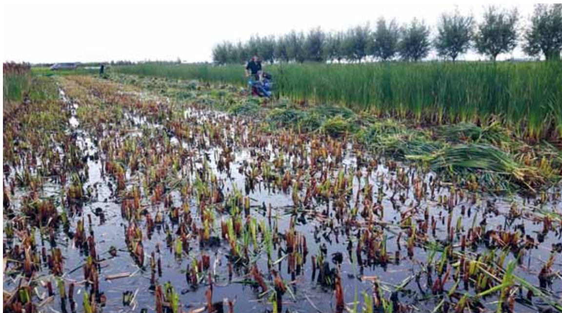
Paludiculture, agriculture on rewetted peat, brings a halt to land subsid- ence and can be used as a hydrological buffer and nutrient buffer in a more sustainable peat landscape

jaren verder onderzoek uitgevoerd naar de rol van bio- bouwers en vraat hierbij.