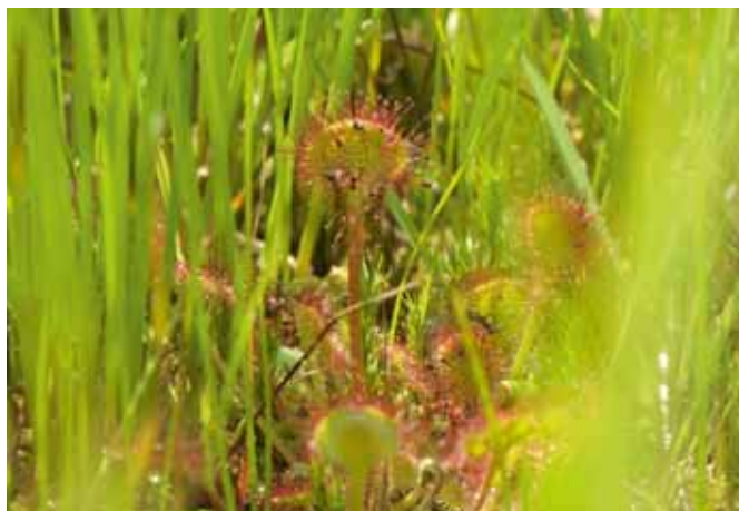
FOTO 3: ZONNEDAUIJ (DROSEROTA ROTUNDIFOLIA) EEN VLEESETENDE PLANT DIE NU TUSSEN HET VEENMOS GROEIT OP DE VEENMOSAKKERS.

Het ontwikkelen van veenvormende veenmosvegetatie op voormalige landbouwgrond blijkt inderdaad mogelijk. Op grote delen van de proeflocatie hebben zich karakteristieke laagveensoorten kunnen zich vestigen en weten zich, in ieder geval op de korte termijn, te handhaven. Naast kenmerkende plantensoorten zien we binnen enkele jaren ook bijzondere laagveenpaddestoelen verschijnen. De broeikasgasemissies worden sterk gereduceerd en de veenmosvegetatie is in staat om netto koolstof vast te leggen. Dit is een geweldig resultaat als je bedenkt dat de uitgangssituatie, een in het verleden sterk bemeste en deels irreversibel verdroogde veenbodem, verre van ideaal is voor de ontwikkeling van laagveennatuur.