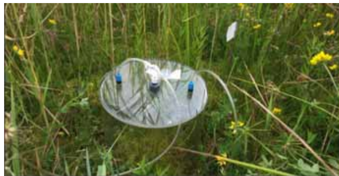
FOTO 4: DE BROEIKASGASEMISSIES WERDEN GEMETEN DOOR EEN FLUXKAMER OVER DE BODEM EN DE VEENMOSVEGETATIE HEEN TE PLAATSEN. IN DE KAMER WORDEN DE VERSCHILLENDE BROEIKASGASSEN GEMETEN. HET RESULTAAT IS EEN BEPALING VAN DE NETTO BROEIKASGASEMISSIE.