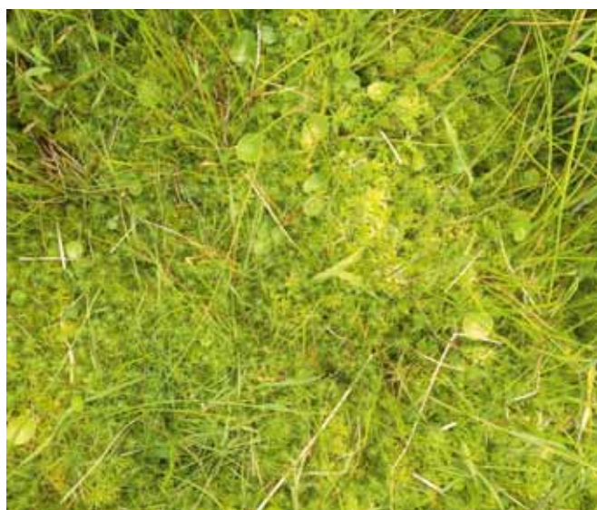
FOTO 2: OP PLEKKEN WAAR DE VOCHTVOORZIENING OP ORDE IS GROEIEN STEKJES UIT TOT EEN VLAKDEKKEND VEENMOSTAPIJT VAN SOMS MEER DAN 7 CM DIK.

We maten dat de broeikasgasemissies op de veenmosakkers sterk zijn gereduceerd ten opzichte van het gedraineerde veenweidegrasland. De veenmosakker neemt in de periode tussen het najaar en voorjaar netto veel CO 2 op, en gedurende de rest van het jaar is de netto CO 2 -emissie sterk gereduceerd in vergelijking met het grasland. In tegenstelling tot wat je zou verwachten, blijven de methaanemissies ook na vernatten erg laag, zelfs lager dan in de oude situatie. Daardoor is CO 2 , en niet methaan, het meest bepalend voor de emissiebalans. De broeikasgasemissies worden door het veranderde landgebruik gereduceerd van een netto uitstoot van +300 tot +620 g CO 2 -equivalenten m -2 j -1 in de gedraineerde referentie naar -86 (netto vastlegging) tot +94 g CO 2 -equivalenten m -2 j -1 . Het vernatten van de voormalige landbouwgrond blijkt de netto uitstoot van broeikasgassen inderdaad al in de eerste jaren na inrichting sterk te verlagen. De verwachting is dat er na een aantal jaar overal netto koolstof wordt vastgelegd, doordat de veenafbraak sterk geremd wordt.