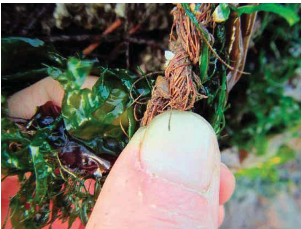
Jonge mossel (boven de duimnagel) heeft zich aan kokosvezel gehecht.