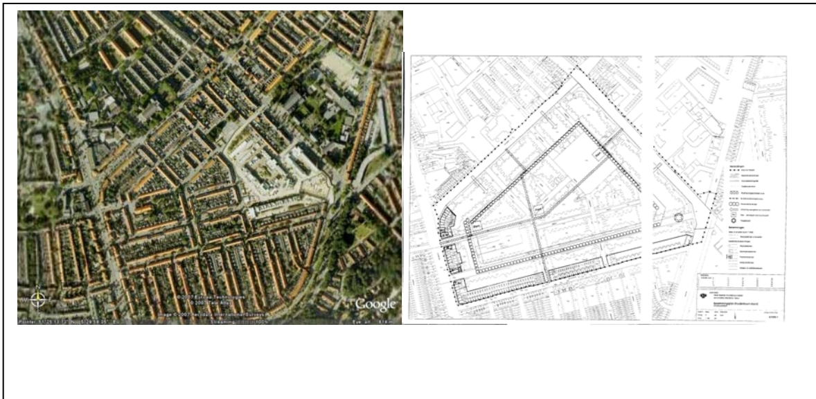
Figura 2. Eindhoven, Kruidenbuurt: foto aérea y mapa de usos del suelo Earth y Plan de usos del Suelo de 2005.