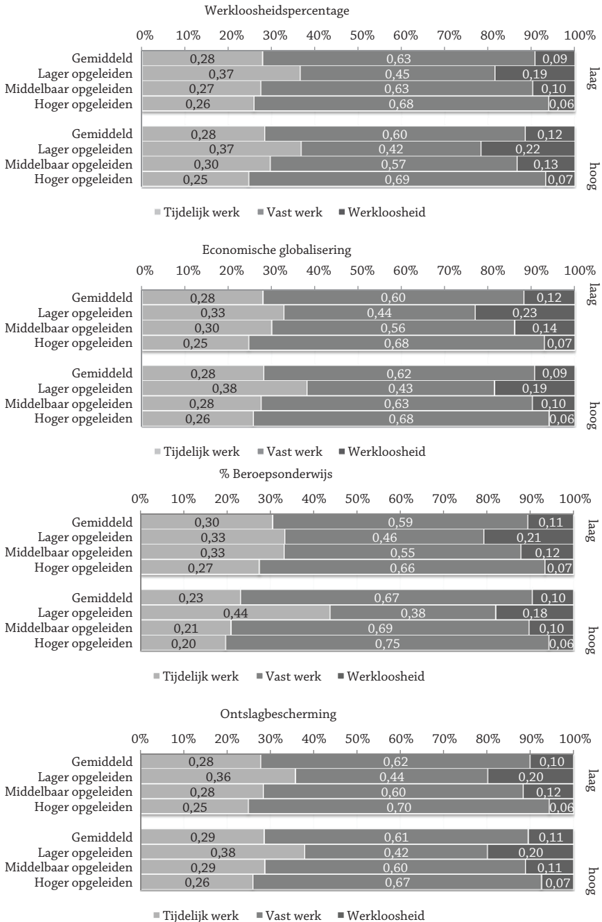
Figuur 3 De voorspelde kans op tijdelijk werk, vast werk en werkloosheid voor jongeren in landen met lage versus hoge scores op conjuncturele, structurele en institutionele factoren