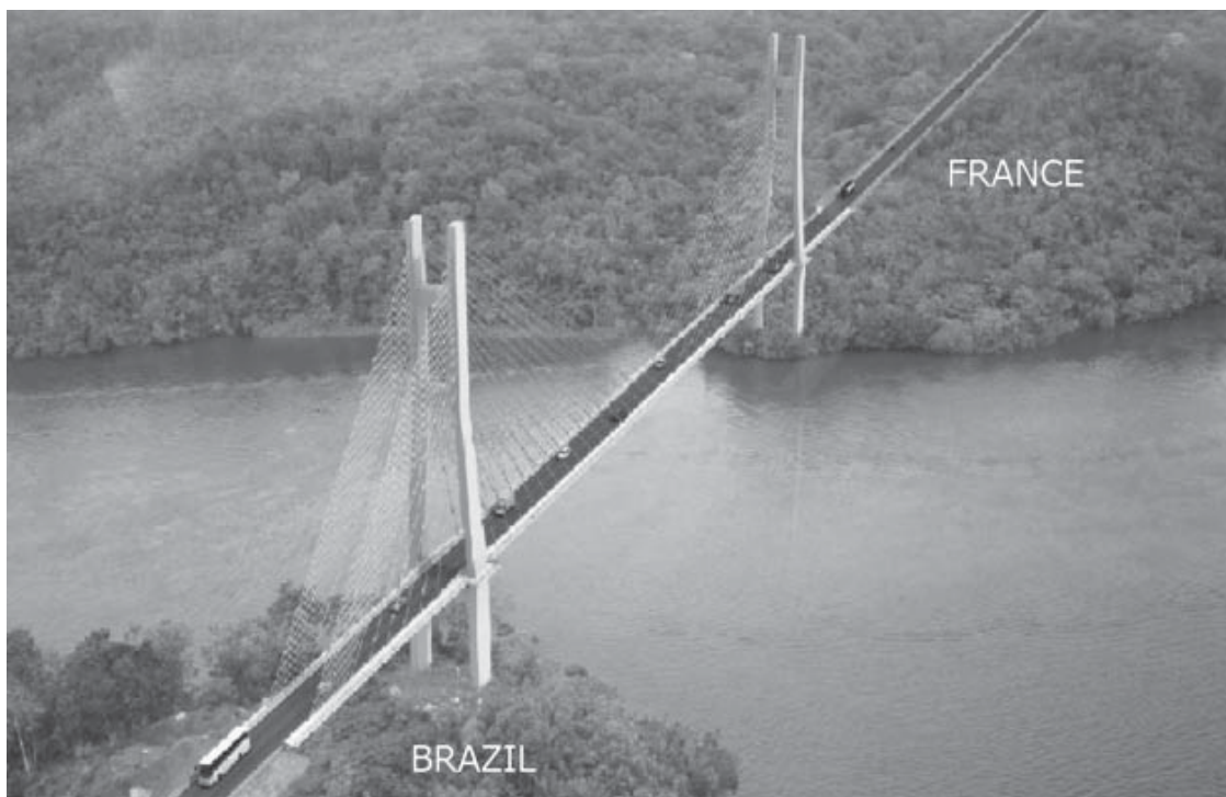
Figura 3. Maqueta del Puente Río Oyapock. “ponteando” Francia y Brasil.

A pesar de los orígenes locales del puente, al llegar el momento del encuentro Lula-Sarkozy, el proyecto transfronterizo había alcanzado ramificaciones de una envergadura geopolítica transatlántica. La naturaleza precisa del juego se podía leer entre líneas al escuchar Sarkozy exclamar en su reunión con Lula: