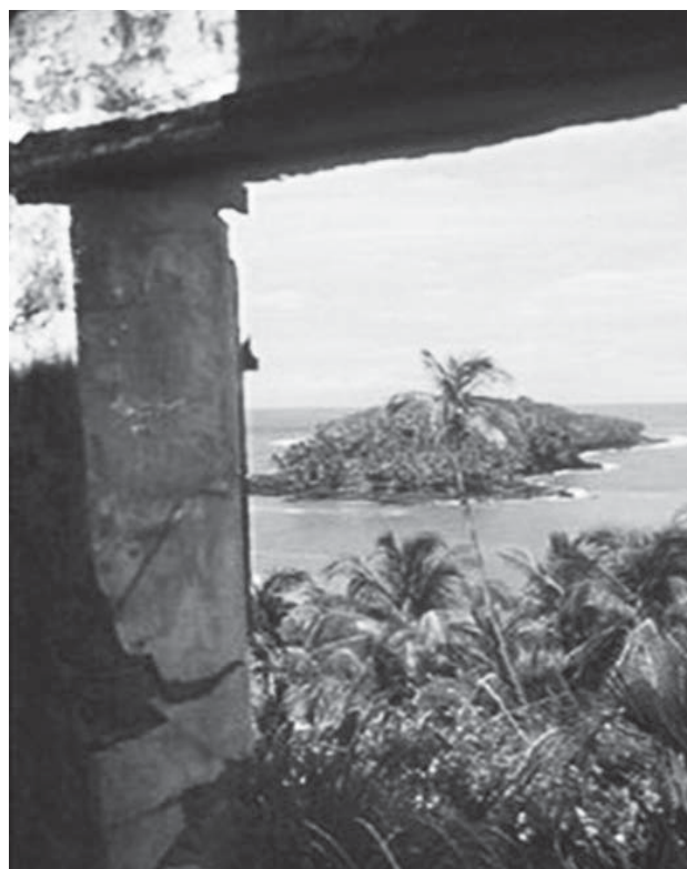
Figura 4. Vista desde las ruinas del baigne francés guyanés. Una mirada todavía prohibida hoy.

Una hipótesis: no poder mirar al mar quitaba al preso político cualquier idea de la esperanza . Además, indicaba una relación de poder desigual: sólo la clase hegemónica en la metrópoli francesa, compuesta en aquel momento por las fuerzas militares nacionalistas de la IV a República, representadas por el símbolo de la flor de lis , tenía el derecho a una visión panóptica que le permitiría subordinar sus territorios coloniales a un régimen ocular en el que todos sus componentes se dirigían unilateralmente hacia Europa, mientras que éstos no podían mirarse entre sí porque quedaban ciegos. La frontera colonial que se produjo a partir de este veto a la mirada, se asemeja en muchos sentidos a las “líneas abismales” de una modernidad/colonialidad que se remonta a la primera expansión europea del S.XV, y cuyo legado seguimos observando hoy en día (Santos, 2010). Efectivamente, el caso de la Guyana francesa contemporánea, con su esfuerzo suspendido para ejercer una verdadera soberanía descolonizadora en relación con la metrópoli francesa 57 , indica que las líneas de visión