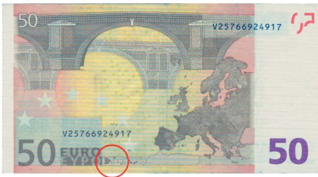
Figura 1. Billete de 50 euros.

Por medio de estos líricos elogios del euro, el buen gobernador del BCE manifiesta una imaginación geográfica bastante difundida en la sociedad y en la política europeas, en la prensa popular y hasta en ciertos círculos académicos; Europa como un territorio unido por países contiguos, con un eje principal conformado por Francia y Alemania, cuyos sentimientos de adhesión y valores ciudadanos irradian por círculos concéntricos, hasta llegar a sus límites orientales con Rusia y meridionales en el Mediterráneo (véase figura 1 4 ).