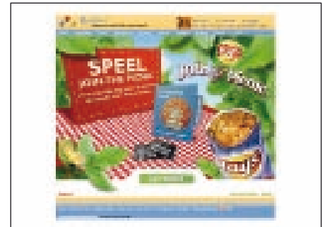
De onderzochte campagnes van Lay's, Telfort en Sony Ericsson.