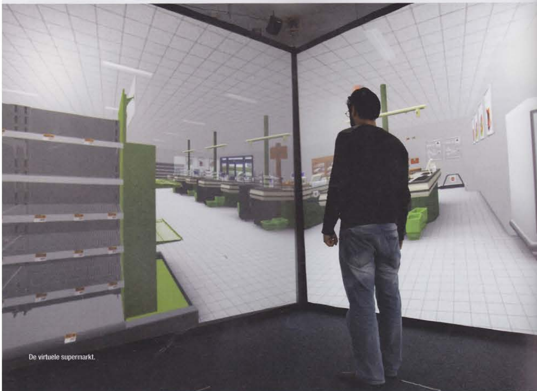
De virtuele supermarkt.

Onderzoekers van de NHTV (Internationaal Hoger Onderwijs Breda), Radboud Universiteit, DVJ Insights en Popai Benelux lieten consumenten in een virtuele supermarkt advertenties via de smartphone ontvangen wanneer men langs het geadverteerde product liep. De uitkomsten laten zien dat 'location based advertising' effectief is.