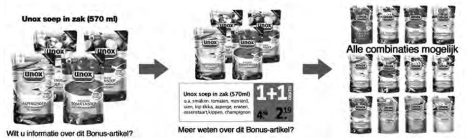
FIGUUR 3 Van links naar rechts: (1) Advertentie (2) Advertentie na eerste pull (3) Advertentie na tweede pull

'nee'-knoppen kon de respondent respectievelijk toegang tot meer 'sales'-informatie krijgen of de advertentie sluiten.