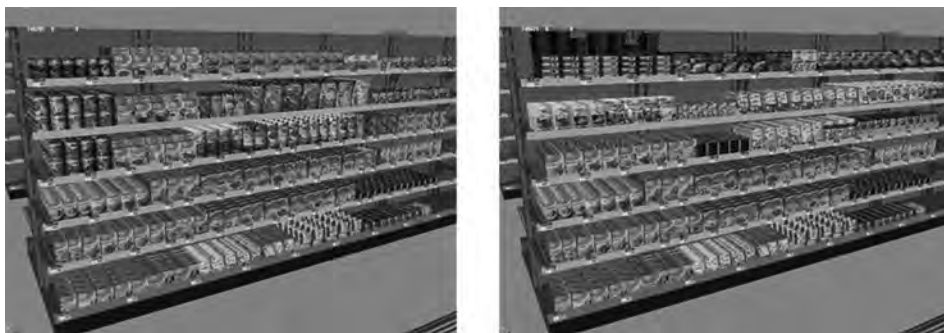
FIGUUR 1 Links: Het schap waar de fit-groep zijn advertentie ontving. Rechts: Het schap waar de misfit-groep zijn advertentie ontving

nog niet ondersteunde, konden de producten door de respondent niet worden opgepakt. Daarentegen was een grijpbeweging naar het gewenste product voldoende. Indien de grijpbeweging succesvol was geregistreerd, werd dit door een discreet belgeluid bevestigd.