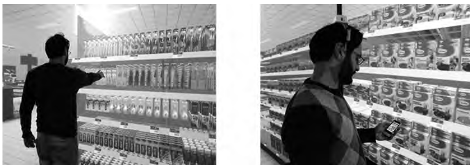
FIGUUR 2 Links: De respondent maakt een grijpbeweging (in scene gezet). Rechts: De respondent ontvangt een advertentie (in scene gezet)

Het virtuele interieur was qua inrichting gebaseerd op een ‘gemiddelde’ supermarkt van een populaire Nederlandse supermarktketen. De supermarkt was ten tijde van het experiment nog in ontwikkeling, met als gevolg dat een zesde van alle schappen was gevuld.