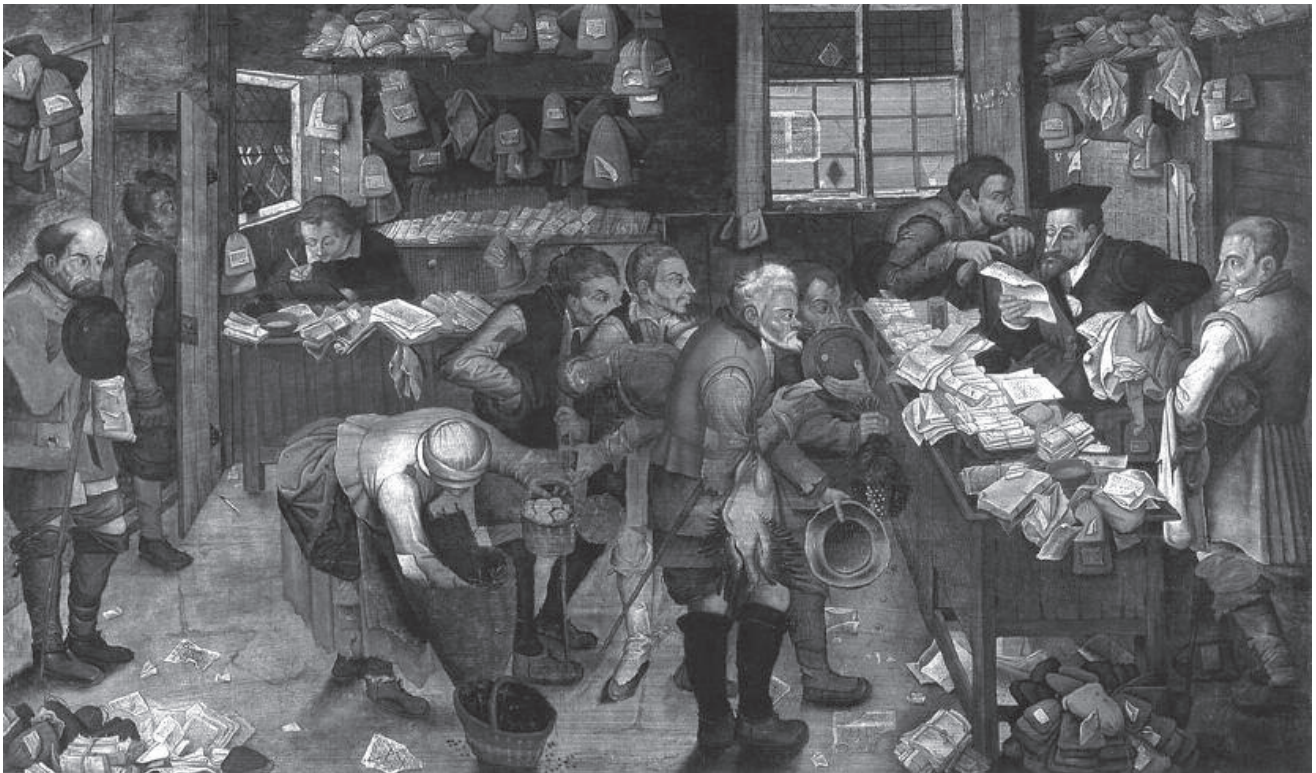
'Dorpsadvocaat' door Pieter Bruegel de Jonge. (Museum voor Schone Kunsten, Gent)