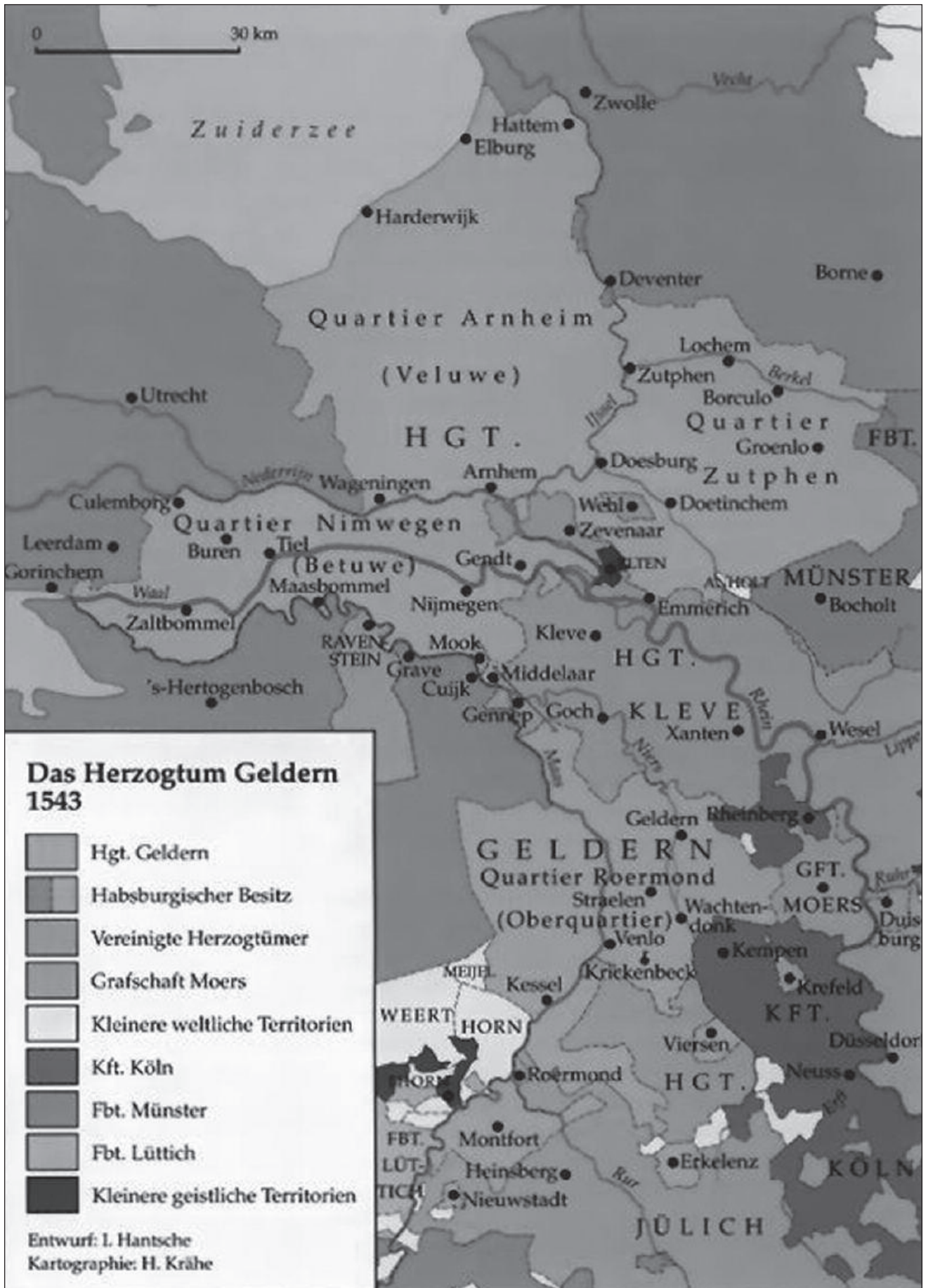
Het hertogdom Gelre in 1543. Uit: I. Hantsche en H. Krähe, Geldern-Atlas, pagina 39, Geldern 2003.