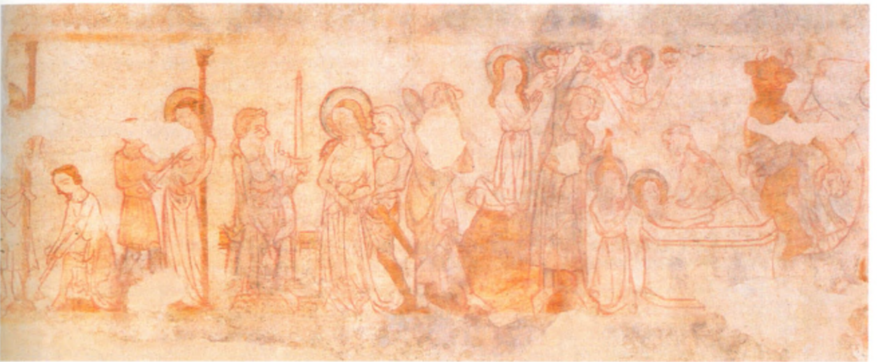
► Een veertiende-eeuwse muurschildering met taferelen uit het leven van Sint-Barbara in de Sint-Jan-de-Doperkerk te Leuven.

met Kind in de Onze-Lieve-Vrouwekathedraal te Antwerpen, daterend uit de jaren 1280-1320 en mogelijk afkomstig uit de Sint-Lambertuskerk te Luik. De veertiende-eeuwse Onze-Lieve-Vrouw-van-Scheve-Lee in de kerk van Onze Lieve Vrouw over de Dijle te Mechelen volgt eveneens dit type.