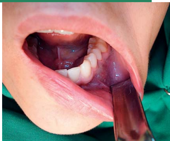
Afb. 1. Zowel linguaal als buccaal van gebitselementen 34 en 35 is een blauw-doorschinerende zwelling zichtbaar.

Om de mogelijke relatie van de afwijking met het foramen mentale en de canalis mandibulae als ook de uitbreiding in