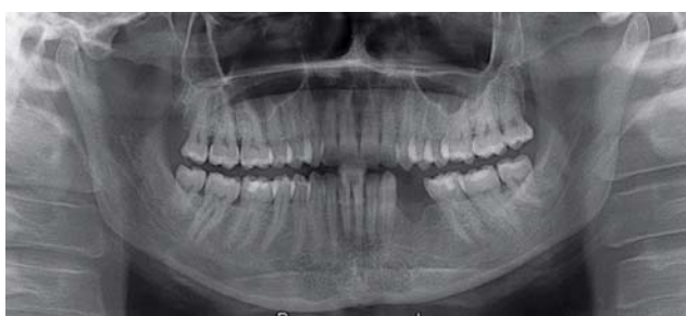
Afb. 5. Panoramische röntgenopname 1 jaar na de behandeling.

incisie een trapeziumvormige buccale mucoperiostlap geprepareerd. Deze liet zich gemakkelijk scheiden van de onderliggende blauwe solide tumor tussen en rond de radices van gebitselementen 34 en 35. Na verwijdering van de gebitselementen 34 en 35 kon de afwijking geheel worden verwijderd. De wond werd primair gesloten. Wortelresorptie, hoewel röntgenologisch niet zichtbaar, bleek na extractie van gebitselementen 34 en 35 toch aanwezig te zijn (afb. 4). Het histopathologisch onderzoek liet een beeld zien passend bij een centrale reuscellaesie.