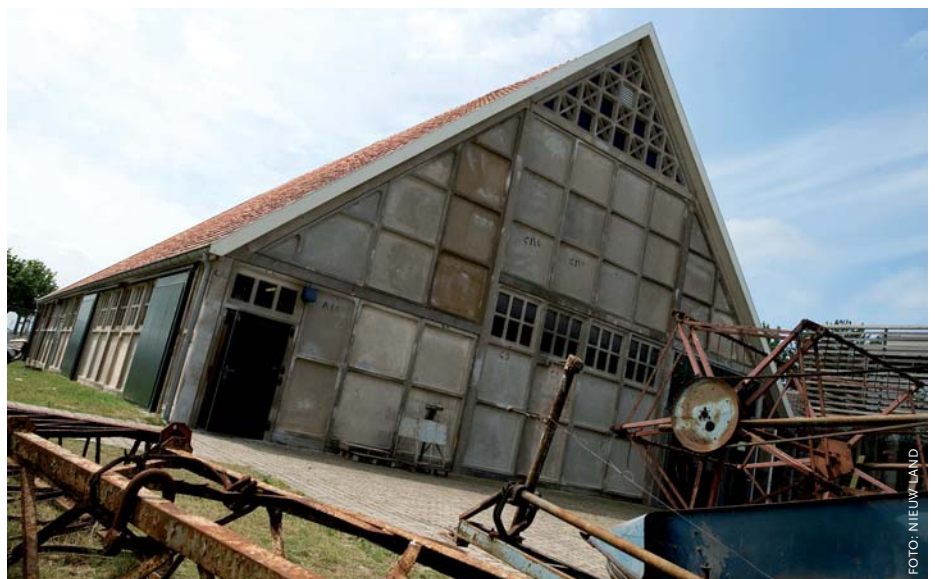
De typerende schokbetonnen 'Polderschuur' uit de Noordoostpolder.

De bomengordels waren ooit bedoeld als windvangers in de kale Noordoostpolder, maar geven de dorpen ook een vriendelijke uitstraling. Bomenaanplant is op veel plekken al een hele verbetering voor de ruimtelijke kwaliteit. De dorpen en agrarische erven zijn in de Noordoostpolder immers herkenbaar als groene oases. Van Assen laat in Tollebeek het bedrijventerrein zien. 'Het is mooi inge-