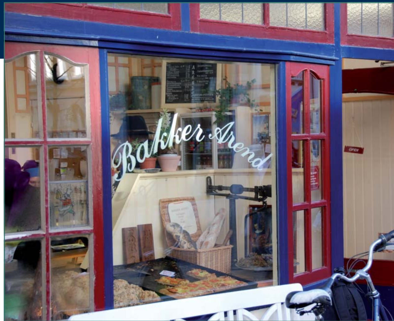
Figuur 3: 'De eigenaar van Bakker Arend vertelde me dat Arnhemmers speciaal voor hun mueslibollen naar Nijmegen komen. Een lokale zaak met een bovenlokale functie' (afkomstig uit de presentatie van Door Hendriksen).

steden op eigen wijze, markeert deze en richt deze op een bepaalde manier in. Standbeelden, posters, graffiti, verbodsborden, hekwerken, beplanting, voorzieningen, of juist het ontbreken daarvan, laten zien hoe mensen een bepaalde ruimte betekenis geven. Het zijn niet alleen materiële zaken die de identiteit van een plaats bepalen. Ook de aanwezigheid (of afwezigheid) en het gedrag van mensen op die plaatsen dragen bij aan de identiteit. Door hun activiteiten, wijze van kleden, manier van voortbewegen en inkopen geven ze die plek een bepaalde sfeer en uitstraling die vaak weer afwijkt van andere plaatsen (figuur 1).