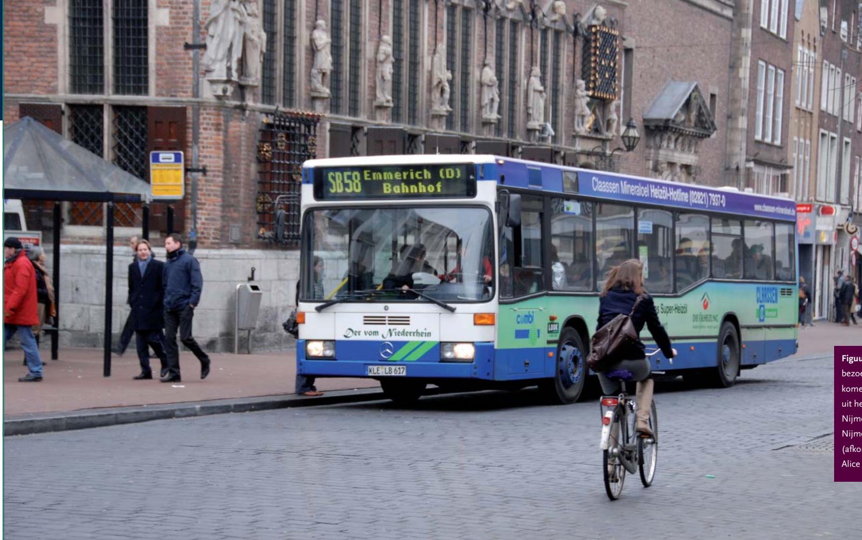
Figuur 4: 'Door de week zijn de bezoekers lokaal. In de weekenden komen er meer regionale bezoekers uit het verzorgingsgebied van Nijmegen, ook Duitsland. Dit geeft Nijmegen een bovenlokaal karakter' (afkomstig uit de presentatie van Alice van der Vlugt).

De moeite die de leerlingen tijdens de Aardrijkskunde Olympiade hadden met deze andere manier van kijken naar ruimtelijke identiteiten, maakt duidelijk dat er een kloof is tussen wat er op universiteiten gebeurt en wat er in het voortgezet onderwijs wordt behandeld. In het universitaire onderzoek is de focus in de jaren negentig verschoven van de bestaande ruimtelijke differentiatie naar de sociale processen die ruimtelijke differen-