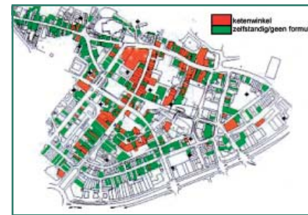
Figuur 2: Winkels in de binnenstad, onderverdeeld in ketens en zelfstandigen/zonder bekende formule (Locatus, 2004; afkomstig uit de presentatie van Tineke Pool)

Zo wordt de identiteit van een plaats bepaald door ons alledaags handelen. Dat er tussen de verschillende betekenissen en het bijbehorende gebruik fricties kunnen bestaan spreekt voor zich. De betekenis van een binnenstad is daarmee zeer heterogeen en dynamisch. Wat een binnenstad maakt en is, wordt in het huidige mondiale tijdperk steeds meer beïnvloed door wat er in de rest van de wereld gebeurt. Winkelstraten laten processen van globalisering duidelijk zien door de vestiging van winkelketens die over de hele wereld te vinden zijn, internationale trends in de etalages, buitenlandse restaurants, het gedrag van toeristen, enzovoort (figuur 2).