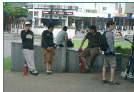
Figuur 1: Een groep jongeren van allochtone afkomst hangt rond op Plein '44 (afkomstig uit de presentatie van Jorrit Seinstra).

Het zijn niet plaatsen die mensen maken, maar mensen die plaatsen maken.