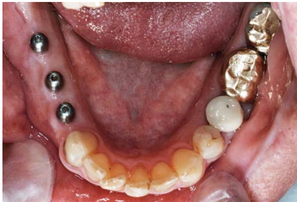
Afb. 3. Klinische opname van een asymmetrisch extreem verkorte tandboog in de onderkaak, 'verlengd' met implantaten.

structuren (sinus maxillaris, foramen mentale). Een ander alternatief is een tweedelige brug met de cuspidaat als pijler en een eerste premolaar als pontic. Door de lengte van de klinische kroon en de grootte van het parodontale oppervlak van een cuspidaat kan voldoende retentie worden gecreëerd voor een conventionele brug, terwijl ook een tweedelige adhesiefbrug een relatief gunstige prognose heeft (Jepson et al, 2001; Van Dalen en Feilzer, 2003). Hiermee wordt beoogd een stop voor de sluitbeweging van de onderkaak te creëren. Uit het oogpunt van gebitsfuncties is dit echter een compromis omdat aan beide zijden slechts 1 occluderend paar van eerste premolaren wordt gerealiseerd. Langetermijnonderzoek naar deze tweedelige vrij-eindigende adhesiefbruggen is nog slechts op beperkte schaal uitgevoerd, dus terughoudendheid en verder klinisch onderzoek zijn geboden.