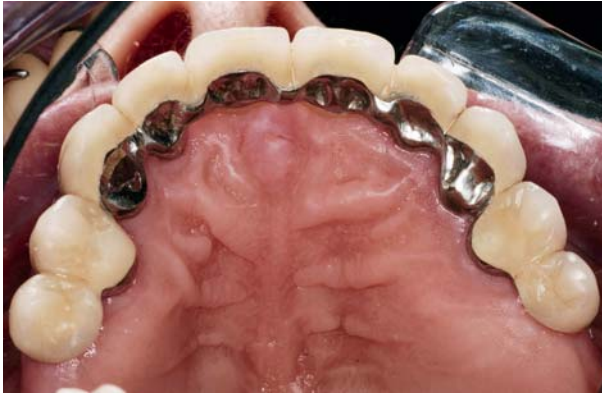
Afb. 1. Een onderbroken, extreem verkorte tandboog behandeld met een vaste prothetische constructie. Het resultaat daarvan is een middelmatig verkorte tandboog. Deze 10-delige vrij-eindigende brug was bij het maken van de foto ruim 19 jaar in situ .