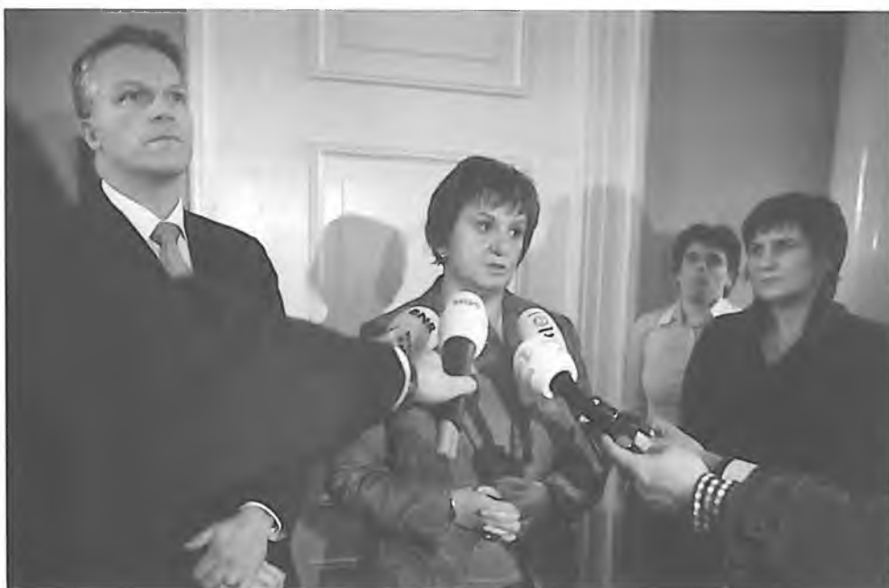
Tijden van crisis in de PVDA. Minister Wouter Bos, fractieleider Mariëtte Hamer en partijvoorzitter Lilianne Ploumen tijdens een persconferentie naar aanleiding van het aftreden van Ella Vogelaar als minister van Wonen, Wijken en Integratie, 13 november 2008