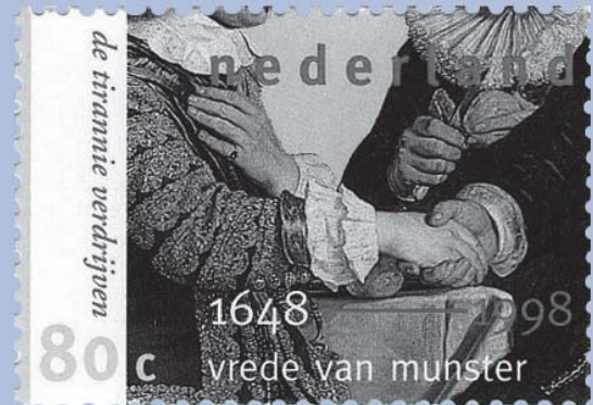
De handtasting op het schuttersstuk van Van der Helst als detail op een postzegel ter herinnering aan de Vrede van Munster.