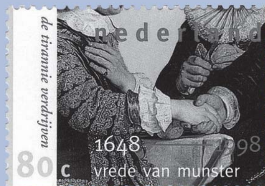
De handtasting op het schuttersstuk van Van der Helst als detail op een postzegel ter herinnering aan de Vrede van Munster.