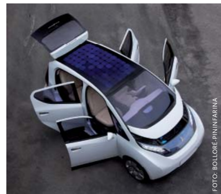
De Bolloré-Pininfarina BlueCar kun je nu al online bestellen en moet nog dit jaar op stroom uit zonnecellen en het stopcontact gaan rijden.

Nederland is hard op weg een pionier te worden op het gebied van elektrische mobiliteit. In mei gaf minister Eurlings zijn zegen aan de eerste volledig elektrische auto die op de Nederlandse wegen mag rijden: de ThinkCity. En nog geen week later deed staatssecretaris De Jager van Financiën er een schepje bovenop met de aankondiging van ruimhartige belastingvoordelen voor elektrisch rijden. Ook milieuminister Cramer maakt zich er hard voor. Natuur en Milieu heeft zelfs samen met een aantal universiteiten een actieplan elektrisch rijden gepresenteerd waarin