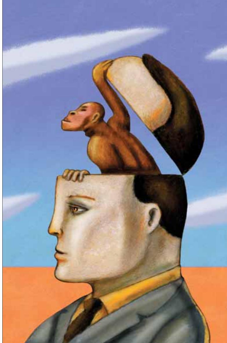
'Primordial Instinct' door Alberto Ruggieri

God had de regels inderdaad kunnen geven. Ze waren doeltreffend genoeg om het volk bij elkaar te houden en te laten overleven. Maar deze regels verschenen niet voor het eerst met de stenen tafelen. Deze regels zijn terug te vinden bij praktisch alle ons bekende beschavingen en groepen. Sterker nog, ook bij dieren gelden dergelijke regels. Zo is ook bij Rhesusapen vastgesteld dat apen die hun ontdekking van voedsel niet melden vaker worden aangevallen en uiteindelijk minder voedsel binnen krijgen