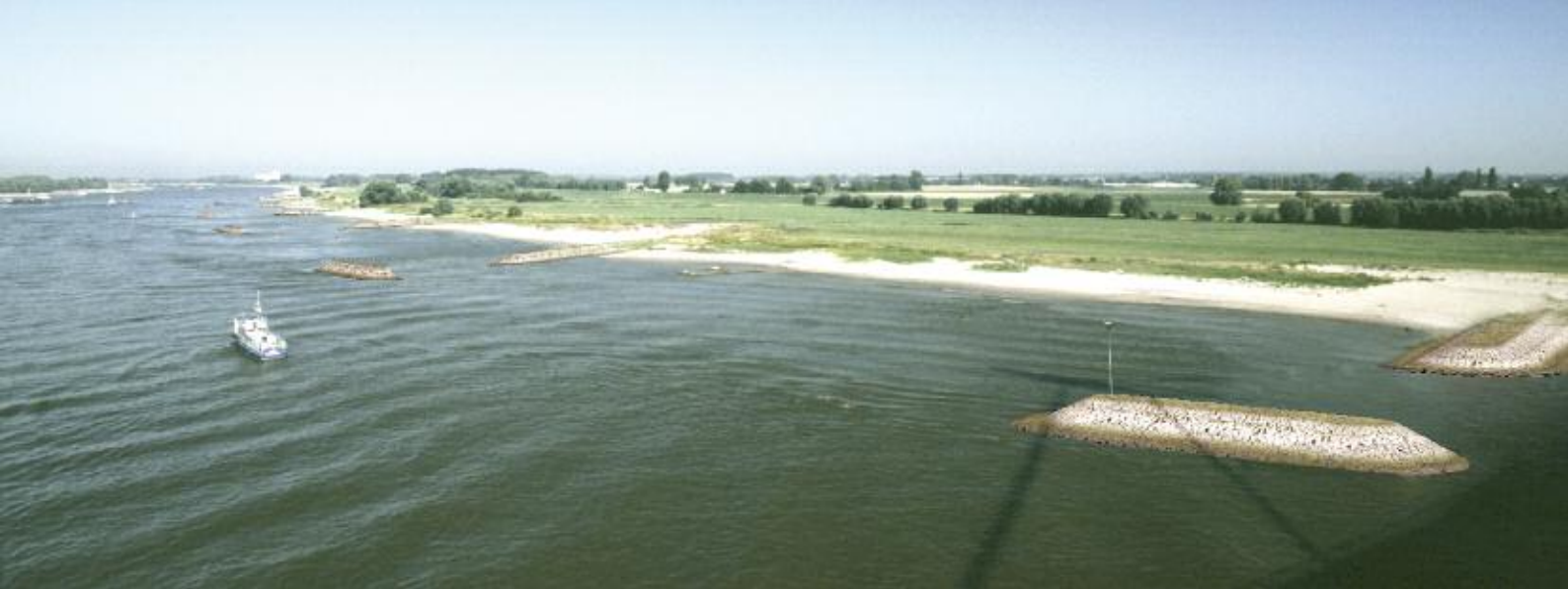
Foto 2. Computersimulatie van het aanzicht van de eilandkrib.

korfmosseel ( C. fluminalis ). Ook bij vissen nemen exoten toe. Naast de Roofblei ( Aspius aspius ) is een aantal grondelsoorten soms zeer dominant, zoals Witvinggrondel ( Romanogobio belingi ), Zwartbekgrondel ( Apollonia melanostomus ), Gemarmerde grondel ( Proterorhinus marmoratus ) en Kessler's grondel ( Neogobius kessleri ). Kribben en andere hydraulische kunstwerken vormen harde substraten waar slechts weinig soorten kunnen gedijen. Bovendien ontstaan rondom de kribben krachtige waterkolken waardoor planten moeilijk kunnen wortelen. Dit wordt versterkt door boeg- en schroefgolven en de enorme waterverplaatsingen als gevolg van de scheepvaart waarbij bijna continue water in de kribvakken wordt geperst en er vervolgens weer uit wordt gezogen. De dichtheden van watermacrofauna nemen dan ook sterk af met toenemende turbulentie, maar het aandeel exoten neemt juist toe (fig. 1b). Deze zijn relatief goed bestand tegen de hoge turbulentie en beter aangepast aan het harde substraat (Reeze et al., 2005). Gezien de verbetering van de waterkwaliteit kan nu vooral winst worden behaald voor de aquatische organismen door kribben ecologisch te optimaliseren. Zo is recent een nieuw type krib bedacht, de eilandkrib. Deze verschilt van de gebruikelijke kribben