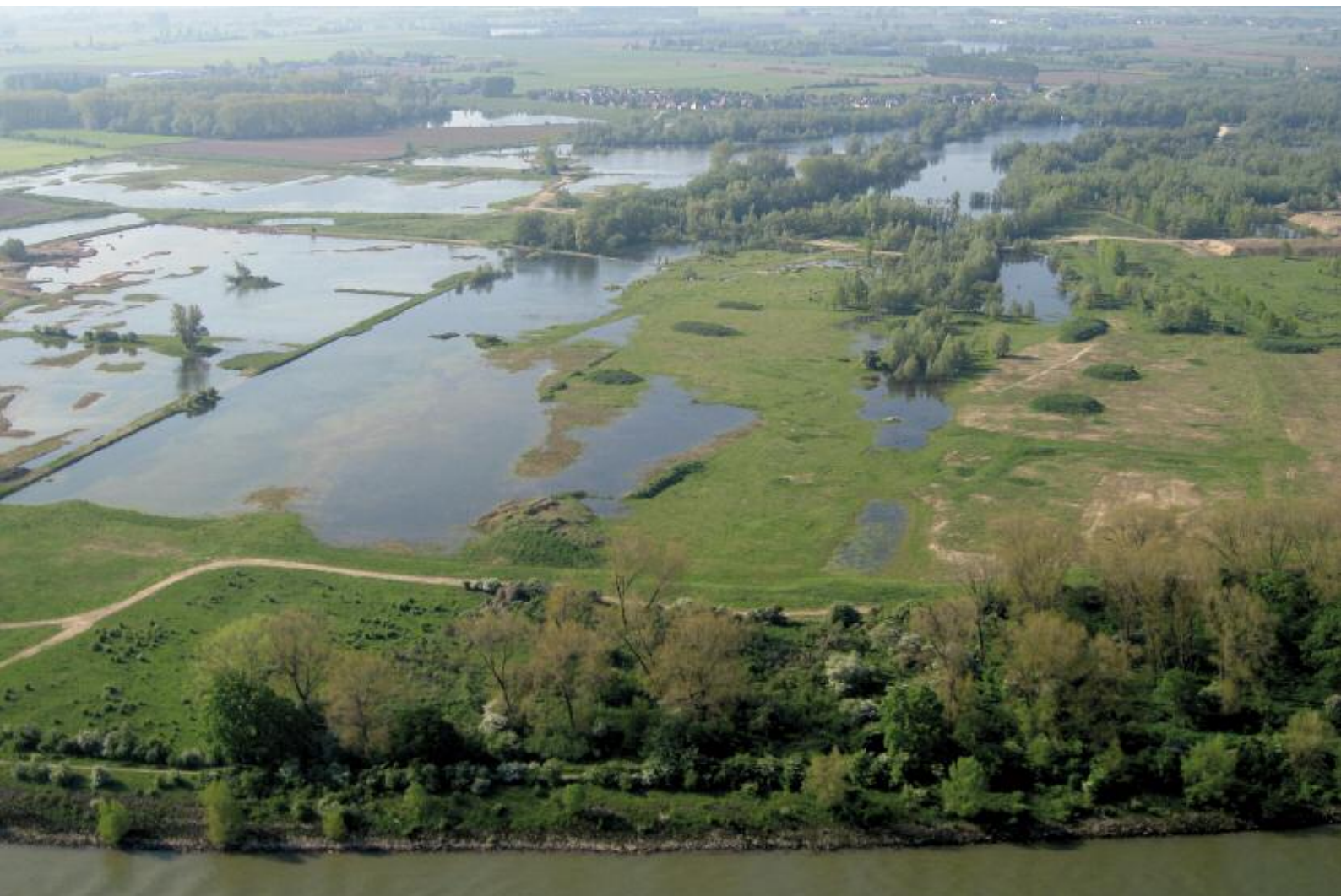
Foto 1. Luchtfoto van de Millingerwaard vanuit het noordoosten met op de voorgrond het Colenbranderbos en op de achtergrond de vingers van de nevengeul die rechts van de foto aantakt op de Waal (stroomt naar rechts). Op grote schaal treedt aanvoer van helder water op als gevolg van rivierkwel. Dit water blijft vrij lang (tot een paar maanden) in het gebied aanwezig en kan daarom van betekenis zijn voor moerasvorming.

De huidige natuurwaarde in nevengeulen en kribvakken is vaak gering, ondanks verbeteringen in de waterkwaliteit. Het ontbreken van geschikt habitat, met name ondiepe en luwre stukken, vormt een knelpunt voor zowel flora als fauna. Daarnaast wordt de watermacrofauna in de Rijn in toenemende mate gedomineerd door exoten, onder andere als gevolg van de Sandoz ramp in 1986, de verbinding van het Rijnsysteem met het Donausysteem, de grootschalige toepassing van harde substraten en de voorheen slechte waterkwaliteit (fig. 1a; Arbačiauskas et al., 2008; Leuven et al., 2009). Het betreft onder andere enkele kreeftachtigen ( Dikerogammarus villosus en Chelocorophium curvispinum ) en mossels, zoals de Driehoeksmossel ( Dreissena polymorpha ), de Aziatische korfmossel ( Corbicula fluminea ) en de Toegeknepen