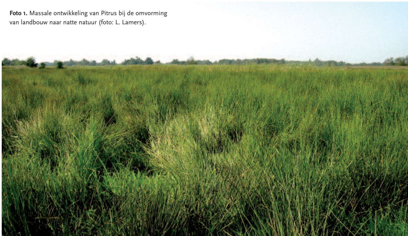
Foto 1. Massale ontwikkeling van Pitrus bij de omvorming van landbouw naar natte natuur (foto: L. Lamers).

trificatie en anaerobe ammoniumoxidatie. Fosfaat wordt echter goed gebonden in de bodem aan ijzer, aluminium of kalk, of in organische vorm. Het verschil tussen nitraat en fosfaat is duidelijk zichtbaar in een diepteprofiel van de bodem vóór en na omvorming van landbouw naar natuur (fig. 1). Ook nu de jaarlijkse depositie van stikstof is afgenomen tot zo'n 30 kg per hectare, is het echter nog altijd moeilijk om Pitrus in toom te houden via een lage stikstofbeschikbaarheid (stikstoflimitatie). Bij voedselarmere vegetatietypen zoals schraallanden en heiden op veen of zand, hoogvenen en vennen, is een maximale stikstofaanvoer van 10 kg per hectare per jaar noodzakelijk voor een goede ontwikkeling (Bobbink & Lamers, 1999). Daarom is vooralsnog het terugdringen van het fosforaanbod meestal het meest succesvol. Uit proeven en veldmetingen blijkt dat zowel de kieming en overleving van Pitrus als zijn groei sterk gestuurd worden door de beschikbaarheid van fosfaat (Smolders et al., 2006). De totale concentratie van