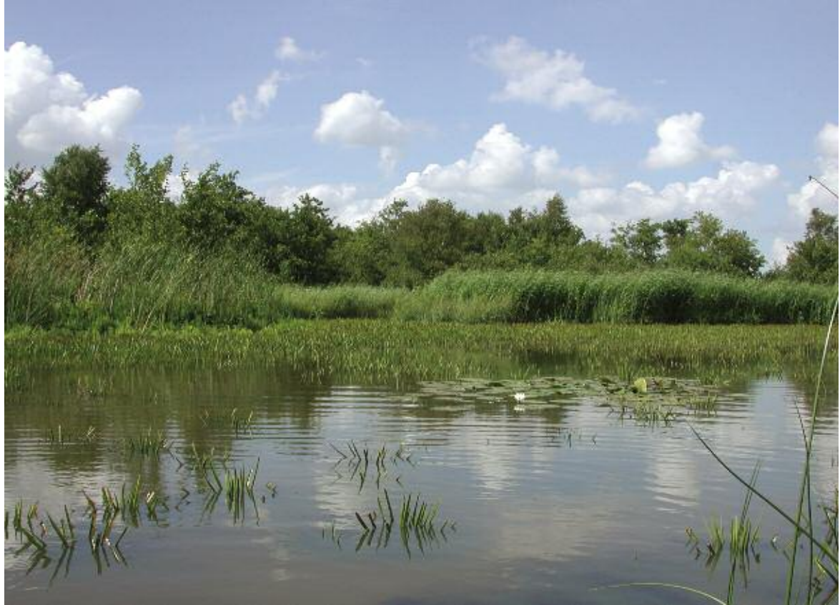
Foto 1. Verlandend laagveenwater in De Wieden.

Inlaat van water met een slechte waterkwaliteit kan dus een versnelde mobilisatie van voedingsstoffen uit de veenbodem tot gevolg hebben. Dit proces wordt interne eutrofiëring genoemd (Roelofs & Smolders, 1993). Juist in laagvenen, met een stapeling van niet alleen koolstof maar ook van voedingsstoffen als fosfor en stikstof, kan er daardoor sprake zijn van een tijdbom, met name als de belasting met deze nutriënten in het verleden hoog was.