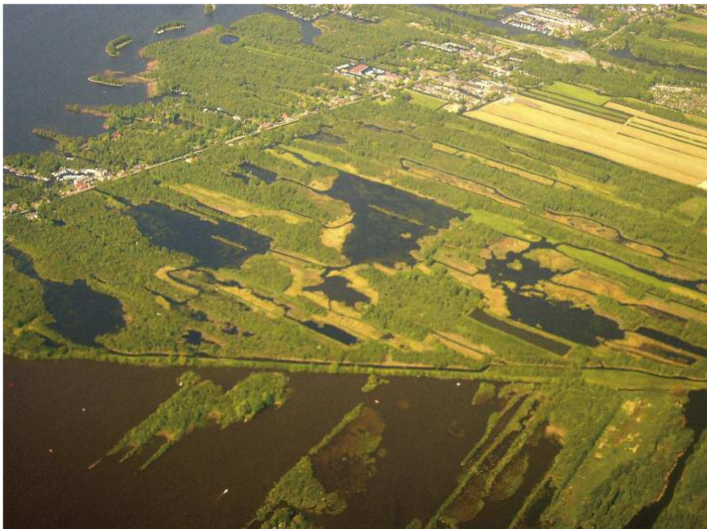
Foto 2. Vanuit de lucht is het verschil in troebelheid (door opwervend slib en algen) tussen het relatief geïsoleerde natuurgebied Het Hol (midden) bij de Loosdrechtse Plassen en De Vuntus zuidelijk daarvan duidelijk zichtbaar. In de plas De Wijde Blik linksboven is zand gewonnen, waardoor deze dieper, armer aan slib en daarmee helderder is dan de Vuntus.

doende kwaliteit, wel leiden tot herstel van ondergedoken vegetatie en karakteristieke gemeenschappen van watermacrofauna (Verberk & Esselink, 2008). In de Molenpolder, een moeras van petgaten ten noorden van Utrecht, waar baggeren werd gecombineerd met verbeteringen in de waterhuishouding, vestigden zich verschillende karakteristieke soorten dansmuggen, libellen en kokerjuffers. Dit in scherp contrast met de polder Sluipwijk, een veenweidegebied in Zuid-Holland, waar de bagger slechts gedeeltelijk was verwijderd en het baggeren niet was gecombineerd met aanvullende verbeteringen in de waterhuishouding. Hier bleven de water- en bodemkwaliteit te slecht voor herstel van vegetatie en fauna. In de door slechte waterkwaliteit geplaagde Geerplas (Zuid-Holland) bleken defosfatering en baggeren op korte termijn te werken (Michielsen et al., 2007). Door nieuwe afbraak van een blootgelegde, verse laag van fosfaatrijk veen werd de waterkwaliteit na een aantal jaren echter driemaal zo slecht als vóór de maatregelen.