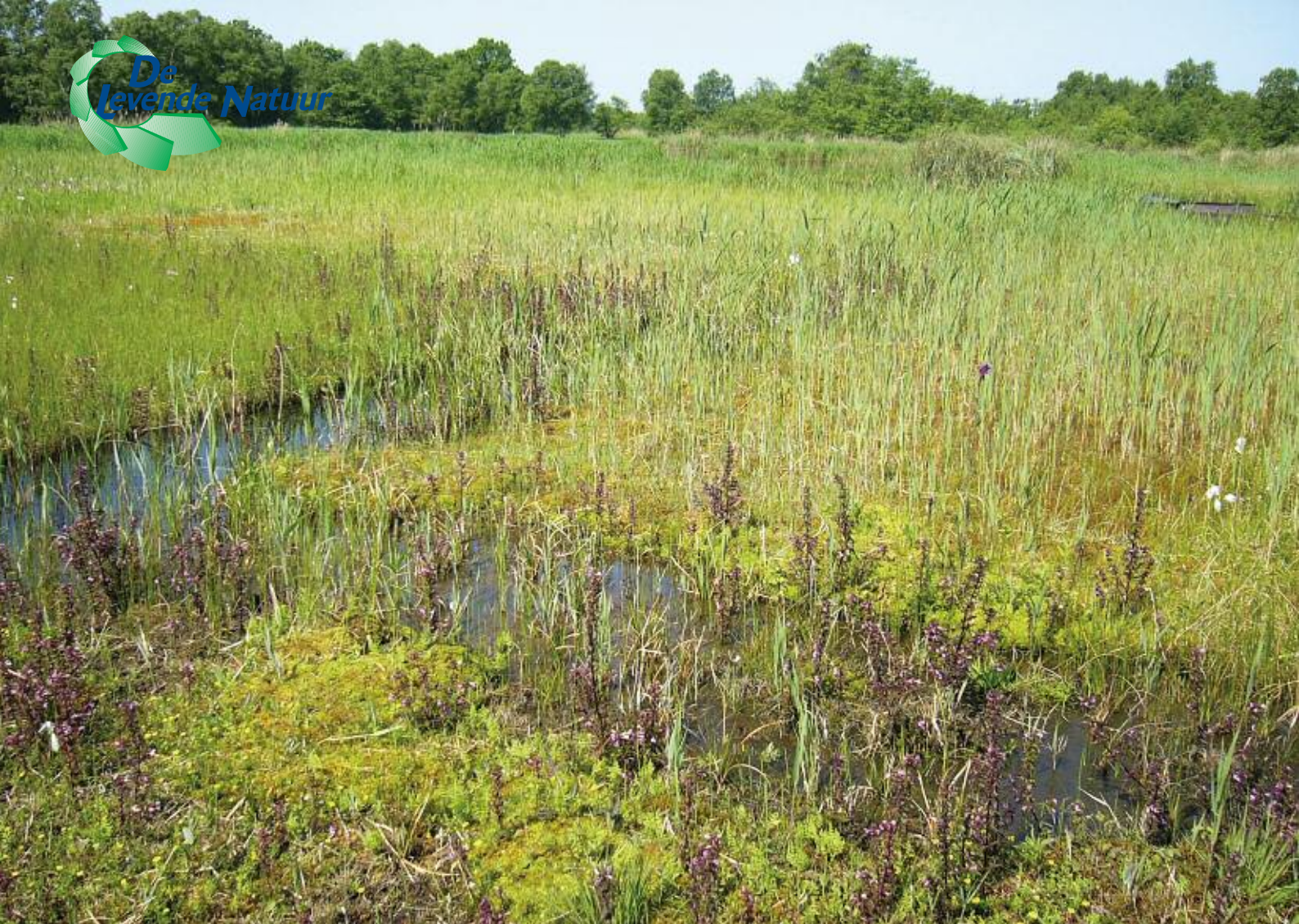
Foto 3. Soortenrijke schraallanden maken een belangrijk deel uit van de biodiversiteit in het laagveenlandschap. Hydrologische maatregelen beïnvloeden zowel de aquatische als de semi-terrestrische natuur, wat ervoor pleit om de beheermaatregelen niet alleen op lokale, maar ook op landschapsschaal te onderzoeken en implementeren.

Juist in onze ondiepe laagveenwateren, met een grote invloed van een bodem die gemakkelijk kan afbreken en nutriënten kan naleveren, is het dus essentieel om ook naar bodemprocessen te kijken. In wateren met een voedselrijke bodem kan duurzaam herstel bemoeilijkt worden door deze erfenis uit het verleden. Het wegvangen van vis die het zoöplankton te zeer uitdunt (actief biologisch beheer) heeft bijvoorbeeld in het Duinigermeer in de Wieden en in Terra Nova bij de Loenderveense Plas (Utrecht) tot spectaculaire verbetering van het doorzicht geleid (Klinge, 1995; ter Heerdt & Hootsmans, 2007). Hoge concentraties van fosfaat in de bodem kunnen echter tot instabiliteit van de heldere situatie leiden, waardoor maatregelen minder duurzaam worden. Bovendien kan in de slibbodem ophoping plaatsvinden van giftige stoffen als ammonium, sulfide en organische zuren. Juist op plaatsen waar niet geschoond wordt, kunnen bijvoorbeeld vitale krabbescheervegetaties in één keer afsterven, terwijl de planten het in nabijgelegen voedselrijkere, maar opgeschoonde landbouwsloten nog wel goed doen. Zoals blijkt uit deze voorbeelden, zal het bij herstelbeheer vaak om combinaties van maatregelen gaan. Op grond van gerichte