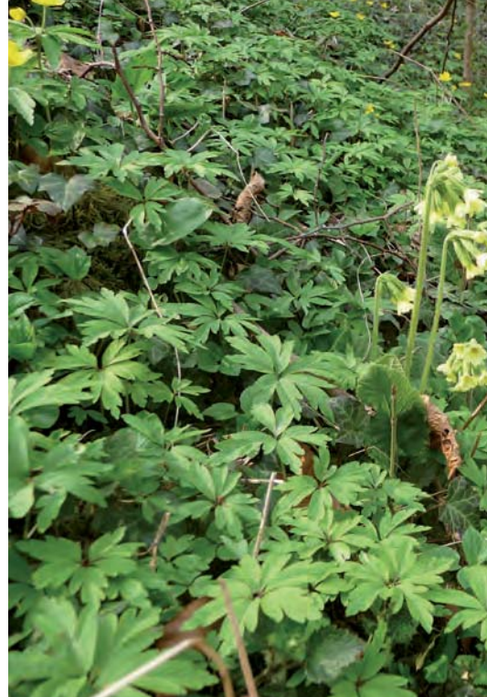
Slanke sleutelbloem is een van de slechts twee Rode-Lijstsoorten die naar verhouding meer voorkomen in natuurlijke dan in door de mens beheerde plantengemeenschappen.

genoemd, waarbij de mens ingrijpt door te plaggen, kappen, beweiden, maaien, akkeren en branden. Om de maat van menselijk invloed preciezer aan te geven wordt wel de term hemerobie gebruikt (zie kader). In een geheel andere benadering wordt uitgegaan van grootschalige natuurgebieden waarin ruimte is voor natuurlijke