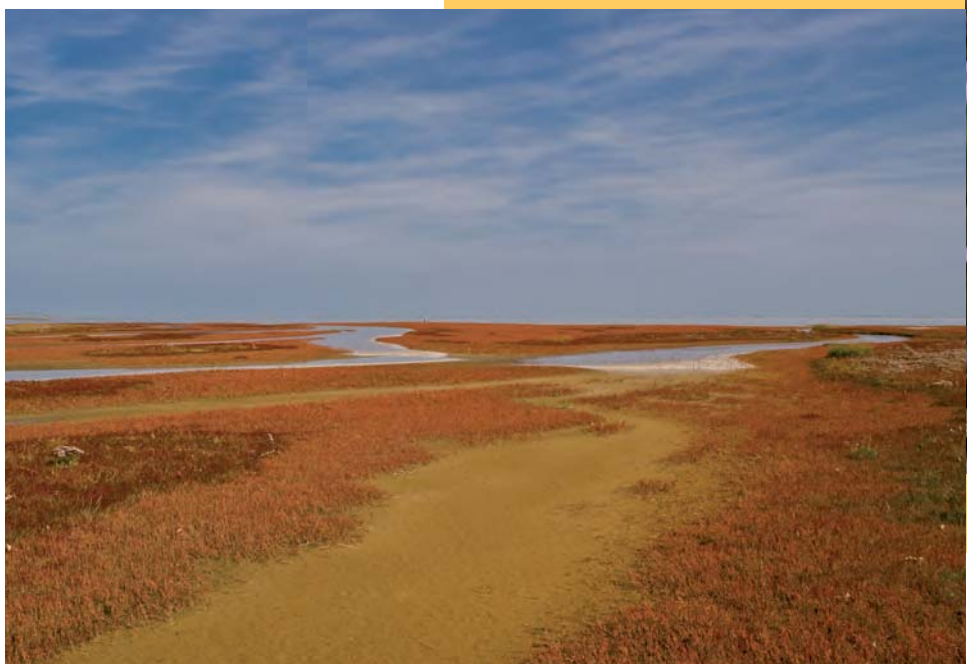
De Vliehors. Kwelderbegroeiingen zijn voor hun voortbestaan niet afhankelijk van menselijk beheer.

processen, zoals landschapsvorming en spontane dynamiek; in het beheer van deze gebieden worden doorgaans grote zoogdieren ingezet. Er wordt wel betoogd dat in dergelijke landschappen, mits voldoende groot en met veel gradiënten, het merendeel van onze soorten een onderkomen zou vinden. Is dit daadwerkelijk het geval of kunnen we voor het behoud van onze soortenrijkdom niet zonder het op gezette tijden ingrijpen door de mens?