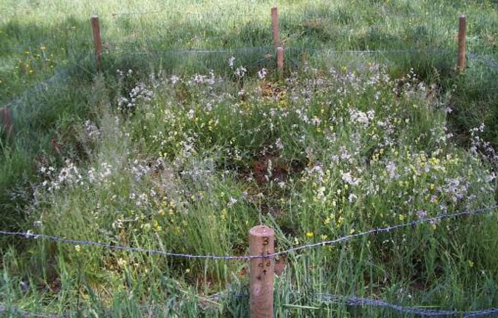
Foto 1. Zinkvegetatie in één van de plots in mei 2007, na afgraven van 20 cm fosfaatverrijkte zinkrijke bodem.

zich in het eerste jaar sterk uitgebreid en zich vervolgens tot september 2008 uitstekend gehandhaafd (foto 1; fig. 2). De bedekking van grassen was gedurende de eerste twee jaar laag, maar is na drie jaar in twee van de zes proefvelden iets toegenomen. Het verhogen van de zinkbeschikbaarheid via het aanbrengen van mijnafval heeft niet geleid tot extra stimulans van de zinkvegetatie, wat erop wijst dat de zinkbeschikbaarheid in de bodem zeker toereikend is voor een goede ontwikkeling van de zinkvegetatie (fig. 2).