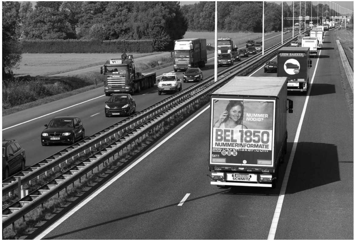
Noord-Brabant, Oirschot, A 58.

rasiet Microplitis tristis (vleugelwijdte slechts 3,5 mm) kan als individu gemakkelijk twee kilometer afleggen. Slechts één soort bleek wel last te hebben van isolatie. Hij concludeert dan ook dat invloed van habitatfragmentatie geen belangrijke gevolgen heeft voor het parasietencomplex van de anjeruiltjerupsen, en dus ook niet voor de hoeveelheid vraatschade en de kans op overexploitatie.