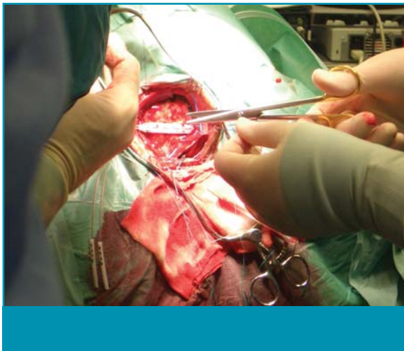
Figuur 3. Plaatsing van motorecortexstimulatie (MCS)-elektrode epiduraal dwars over de sulcus, op het somatotopisch corresponderende deel van de motorische cortex.

een stroomsterkte lager dan de prikkel drempel ('subthreshold') voor het opwekken van motorische reacties. De patiënt neemt geen directe sensaties van stimulatie waar, omdat de effecten op de pijn pas na enige minuten optreden. Dit bevestigt de veronderstelling dat het pijnverminderende effect indirect tot stand komt via dieper gelegen baansystemen. De geleidelijke afname van het pijnstillende effect gedurende een aantal uren, of soms dagen past hier ook bij. Diverse verschillende stimulatie-instellingen zijn mogelijk, waarbij alle 8 polen van de elektrode gebruikt kunnen worden. Amplitude, frequentie en pulsbreedte kunnen vervolgens gevarieerd worden. Volgens een standaard protocol wordt per patiënt bekeken welke stimulatie het beste effect heeft. Het kan 10-20 dagen duren voordat de optimale instelling is gevonden, waarbij onder andere de elektrodepositie en de dikte van de omringende liquorlaag een belangrijke rol spelen. Door variatie in de polariteit tussen de punten op de elektrode die epiduraal is aangebracht, wordt gezocht naar een combinatie die minstens 50% pijnreductie geeft. Dit wordt beoordeeld aan de hand van de VAS-score en gestandaardiseerde vragenlijsten. 27 Daarnaast wordt de patiënt door verpleegkundigen tijdens de klinische fase geobserveerd.