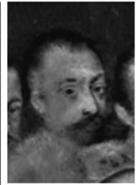
Afb. 3) François Clouet (naar), Karel IX , 3de kwart 16de eeuw, olieverf op paneel, 34 x 25 cm, Versailles, Musée du Château, inv. MV3239; INV9109.

elf personen afgebeeld: zeven mannen en vier vrouwen. Hun aanwezigheid is niet verklaarbaar vanuit de bijbeltekst. De geïndividualiseerde gezichten van deze figuren, alsook hun contemporaine kleding en haardracht maken duidelijk dat het hier om portretten gaat.