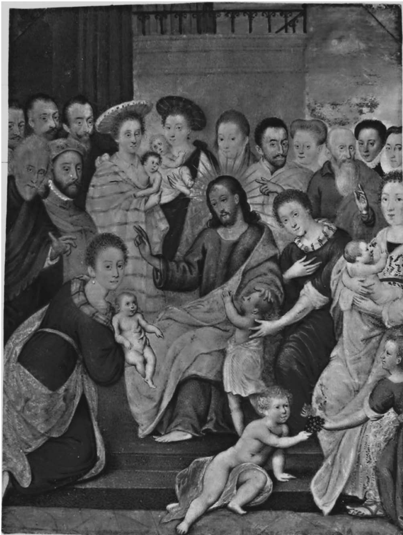
Afb. 1) Anoniem (Frans), Laat de kindertjes tot mij komen , perkament aangebracht op paneel, 17,1 x 12,1 cm, Nederland, privécollectie.