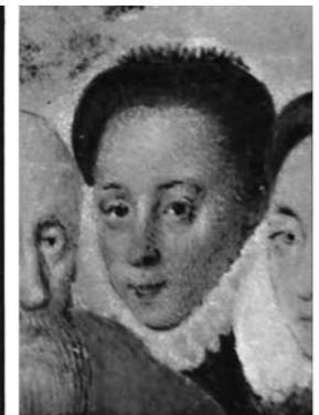
Afb. 9) Omgeving Santi di Tito (voorheen toegeschreven Scipione Pulzone), Maria de' Medici , ca. 1585, olieverf op paneel, Arezzo, Museo Casa Vasari (bruikleen Gallerie Fiorentine).

zichtig de conclusie trekken dat de bijbelse voorstelling waarschijnlijk ontstond in de jaren 1606-07. Hoewel de kroonprins niet ouder lijkt dan 6 jaar, valt het niet uit te sluiten dat de miniatuur pas naar aanleiding van de moord op zijn vader in 1610 werd geschilderd.