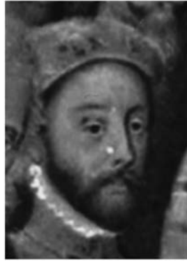
Afb. 2) François Clouet (naar), Hendrik II , ca. 1547, olieverf op paneel, 33 x 22 cm, Versailles, Musée du Château, inv. MV3175; INV3261.