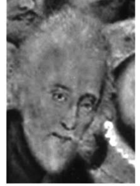
Afb. 11) Anonim (Frans), Gaspard II de Coligny , olieverf op paneel, ca. 1570, Chantilly, Musée Condé (gespiegeld detail).