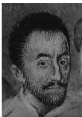
Afb. 4) Etienne Dumonstier (toegeschreven aan), Hendrik III, ca. 1585, tekening, Chantilly, Musée Condé, inv. MN347; B194.