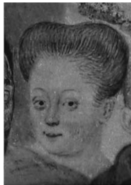
Afb. 8) Anoniem (Frans), Louise van Lotharingen , olieverf op paneel, 32 x 26 cm, Parijs, Musée du Louvre, inv. MI852.