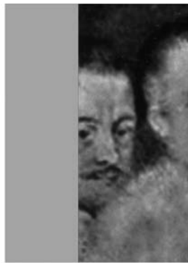
Afb. 12) Anonim (Frans), Lodewijk I de Condé , 1561, olieverf op paneel 32 x 23 cm, Versailles, Châteaux de Versailles et de Trianon, inv. MV3187 (gespiegeld).

Condé, who played an important role in the French Wars of Religion. The story of Christ blessing the little children, recounted in the three synoptic Gospels (Mt 19; Mk 10; Lk 18), has often been connected with the theological debate about infant baptism. Nevertheless, the subject is not only depicted by Protestants but by Catholics as well. In this particular case the grapes – if they are to be interpreted as a symbol of the Eucharist – possibly allude to a catholic commission. The inclusion of royal descendants in the Kingdom of God – represented by the 'immediate adoption of the Lord' by the children – makes it clear that their worldly and hereditary power was legitimate. The French monarchy was thus presented as an institution by the grace of God.