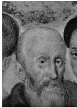
Afb. 10) Anonim (Frans), Michel de l'Hospital , olieverf op paneel, ca. 1570, 34 x 26 cm, Chantilly, Musée Condé, inv. PE270.