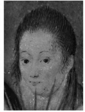
Afb. 7) François Clouet, Catherina de' Medici , ca. 1540-45, tekening in zwart en rood krijt, Chantilly, Musée Condé, inv. MN30; B276.