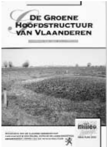
Figuur 2 Richtnota GHS.

Figure 2 Guiding principles for the implementation of Flemish Green Main Structure.