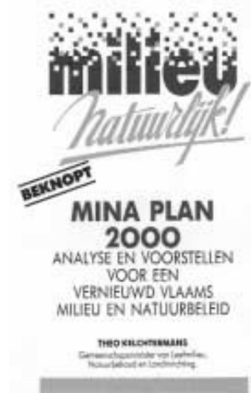
Figuur 1 Het Mina-Plan 2000.