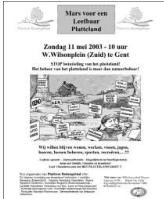
Figuur 2 De affiche waarmee werd gemobiliseerd voor de betoging van 11 mei 2003.

Toch keurde, nadat de MiNa-Raad in maart 2003 haar advies over het ontwerp-afbakeningsplan VEN 1 e fase had neergelegd, de Vlaamse regering op 27 juni 2003 het voorontwerp van VEN goed. Op 18 juli 2003 werden de aparte afbakeningsplannen definitief goedgekeurd, ze zijn op 17 oktober in het Staatsblad gepubliceerd. Hiermee was de eerste fase van het afbakeningsproces, beperkt tot de 'groene gebieden' en de 'consensusgebieden', formeel afgerond. Dat hierover al zoveel commotie ontstond, doet vermoeden dat de afbakening van het VEN 2 e fase voor nieuwe en wellicht nog grotere po-