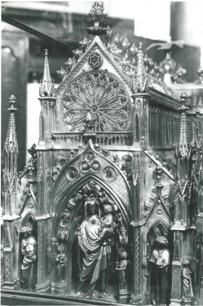
► Het reliefschrijn uit van Sint-Gertrudis uit Nijvel, in 1298 in gebruik genomen en in 1940 ernstig beschadigd bij het bombardement op de stad.

Sculptuur uit de dertiende en de eerste helft van de veertiende eeuw is evenwel schaars, het verhaal moet worden verteld aan de hand van slechts enkele voorbeelden. In de Sint-Martinuskerk te Wezemaal bevindt zich bijvoorbeeld een Calvariegroep uit de tweede helft van de dertiende eeuw en in de Sint-Kwintenskerk te Sint-Kwintens-Lennik een bas-reliëf met de Calvarievoorstelling in een drielobbige nis, mogelijk nog uit het midden van die eeuw. In diezelfde kerk, Brabantse hooggotiek uit de dertiende en veertiende eeuw, staan drie beelden van de heilige Kwinten, Onze-Lieve-Vrouw en de heilige Gertrudis, die afkomstig zijn uit de zuidertransseptgevel en aldus ingepast kunnen worden in de bouwgeschiedenis. Datzelfde geldt voor de – sterk gerestaureerde – rijke portalen van de Onze-Lieve-Vrouw-ten-