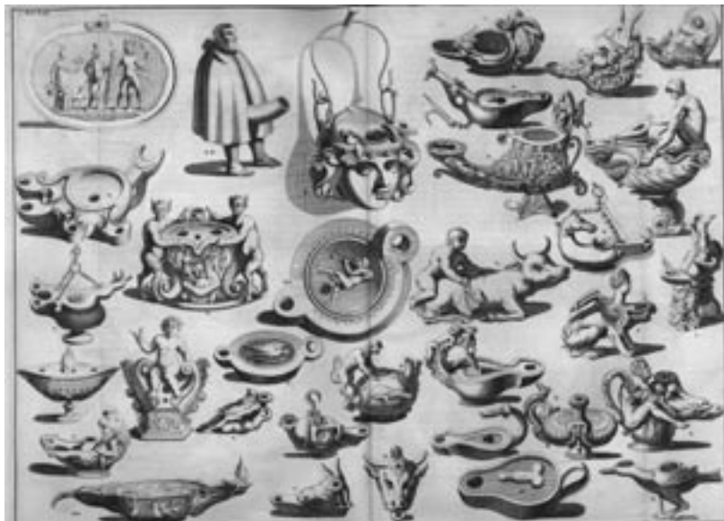
Afbeelding 1: Egyptische priapische olielampen. Uit: Mosaïze Historie . Dl. II, p. 761.

Men kan zich afvragen of de contemporaine lezer dit soort gedichtjes en uitweidingen wel op prijs stelde in zijn bijbelse geschiedenissen. Welke traditionele bijbelinterpretator zou het gedrag van Jakob proberen uit te leggen via verzen van Martialis?