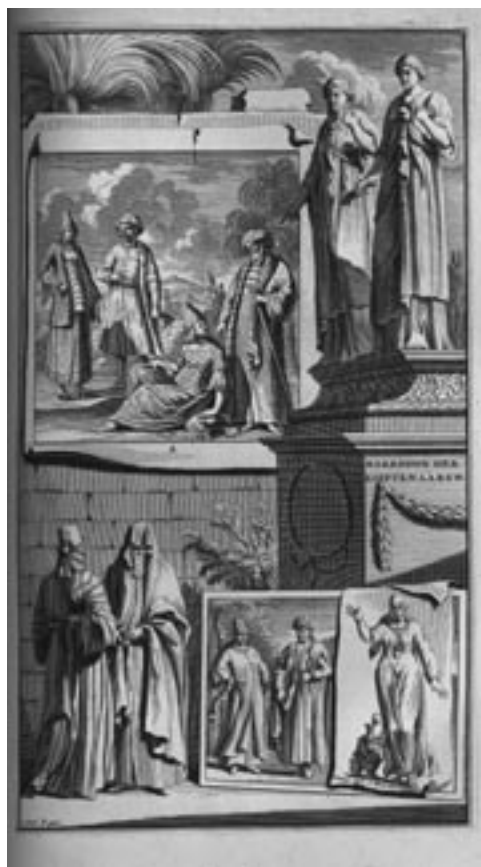
Afbeelding 2: 'De Kleeding der Egyptenaren'. Uit: Mosaïze Historie. Dl. II, p. 541. Rechtsonder een 'vrouw uyt het bad komende'. Goeree geeft een uitgebreide verhandeling over de klederdracht der Egyptenaren, o.a. ook of en wat voor onderbroeken zij droegen.

Het zou interessant zijn om Goerees plaats in de geschiedenis der