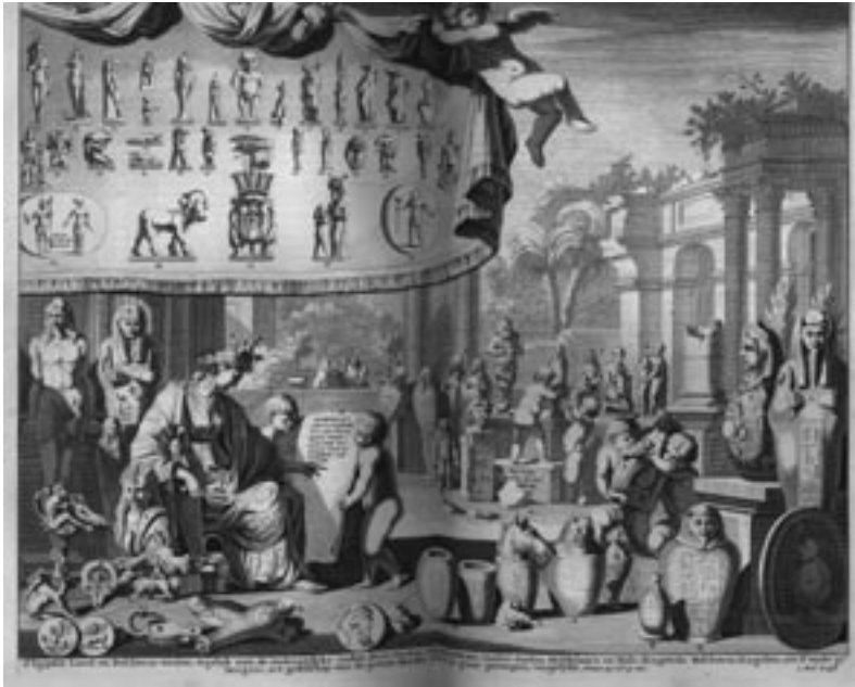
Afbeelding 3: Egyptische goden. Uit: Mosaize Historie . Dl. II, p. 556.

egyptologie nader te onderzoeken. 9 Een vraag is bijvoorbeeld welke bronnen hij precies gebruikte. Veel van zijn kennis lijkt gehaald uit oude bronnen zoals Herodotus, maar hij lijkt ook meer empirisch materiaal te hebben gebruikt. Zo wordt in zijn testament vermeld dat hij in bezit had een ‘schilderije van den Hoge Priester met de goude lijst, de Statiebeelden van Isis anubis, de Egyptize Teraphim, het borstbeeld van Homerus, eenige mathematize instrumenten’. 10 Waarschijnlijk las hij ook de Egyptische reisbeschrijvingen van Cornelis de Bruyn, wiens Reizen over Moskovie door Persie en Indie door Goeree werden uitgegeven. 11 Net als bij De Bruyn is ook Goerees open opstelling ten opzichte van deze niet-christelijke cultuur opmerkelijk Verlicht te noemen. 12