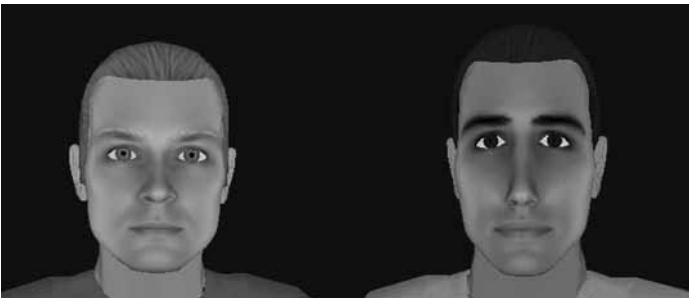
Figuur 3 - Een Nederlandse en een Marokkaanse avatar

houden (zoals kleding, houding, gedrag). In totaal kregen proefpersonen twaalf keer de opdracht het bushokje in te gaan met daarin een Nederlandse (zes keer) of een Marokkaanse (zes keer) avatar. Elke avatar had op de borst zijn naam staan en op de rug een nummer. De opdracht van de proefpersonen was om steeds de naam en het nummer te lezen en zoveel mogelijk namen bij nummers te onthouden. Om dit te kunnen doen moesten proefpersonen steeds om de avatar heenlopen om de naam op de borst en het nummer op de rug te bekijken. Tijdens deze opdracht werd onder andere