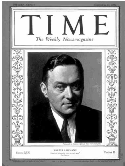
Figuur 1 - Walter Lippmann op de voorkant van Time Magazine (1937)

gedefinieerd en geoperationaliseerd als eigenschappen die in het algemeen toegeschreven werden aan groepen. De nadruk lag vooral op de inhoud van stereotypen.