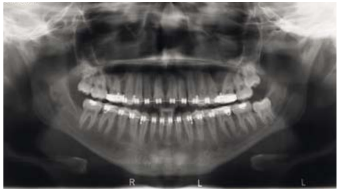
Afb. 4. Orthopantomogram 15 maanden na de behandeling met bijna volledige ossificatie van de laesies.

Zowel het intra- als het extraorale onderzoek laat meestal weinig afwijkingen zien. De sensibiliteit in het verzorgingsgebied van de nervus alveolaris inferior is intact. Zwelling van het kaakbot treedt pas in een laat stadium op en het overliggende slijmvlies is gaaf. De vitaliteit van de gebitselementen is normaal en percussiepijn en verhoogde mobiliteit ontbreken. Verplaatsing of kan-