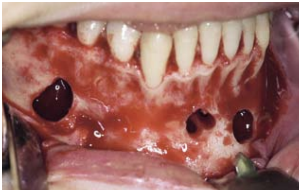
Afb. 3. De openingen naar 2 lege holten in het kaakbot.

reuscelgranuloom of een cemento-ossificerend fibroom worden betrokken (Wood en Goaz, 1997; Scholl et al, 1999).