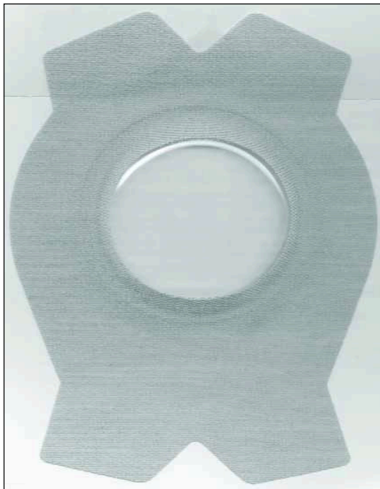
Figuur 3 Horlogeglasverband.

Wanneer enig spontaan herstel optreedt of synkinesen zichtbaar worden, kan gestart worden met mimetherapie (Beurskens, 2003). Mimetherapie is de enige paramedische therapie waarvan het effect op een perifere aangezichtsverlamming is bewezen (Beurskens, 2003). Mimetherapie wordt