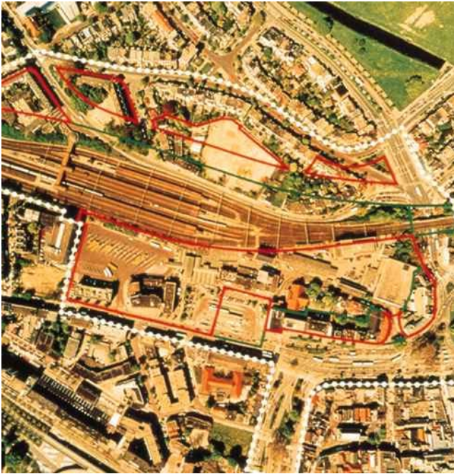
Figuur 1: locatie Arnhem-Centraal