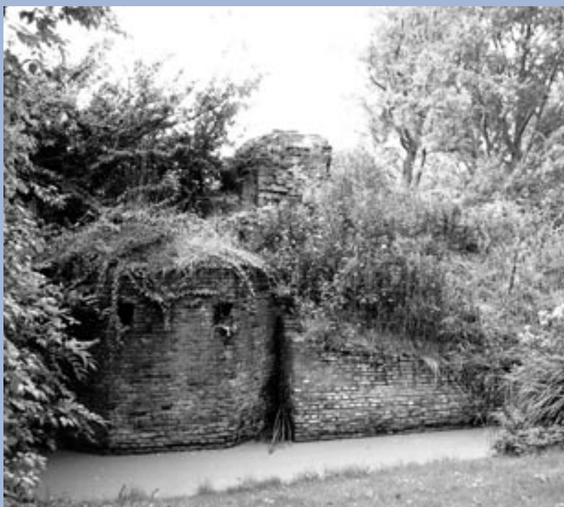
De ruïne van Huis ter Kleef in de Stadskweektuinen, Kleverweg, Haarlem.

De stad werd bevoorraad via het Haarlemmermeer, eerst over het ijs door schaatsers met sleden, in het voorjaar door de Watergeuzen – tot die in april 1573 door een Spaanse vloot uit Amsterdam werden verslagen. Nog hield Haarlem stand, tot er zelfs geen ratten meer te eten waren. Een poging tot ontzet mislukte in juli. De honger maakte overgave onvermijdelijk. Er volgde een gruwelijke moordpartij. Opdat de Watergeuzen het niet als uitvalsbasis voor herovering van Haarlem zouden gebruiken, liet Don Frederik het kasteel opblazen. Haarlem was gevallen – door de honger, niet door het krijgsgeweld. Het had Don Frederik 10.000 man gekost en de mythe van de onoverwinnelijke Spaanse tercio's was gebroken. Bij Alkmaar begon vervolgens de victorie!