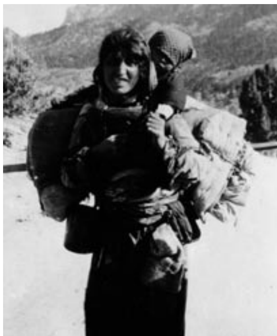
Armeense gedeporteerde, foto van Armin T. Wegner (1915) Informations- und Dokumentationszentrum Armenien te Berlijn.

De Europese mogendheden volgden met belangstelling en niet zonder eigen belang de ontwikkelingen in het Ottomaanse Rijk. Na afloop van de Russisch-Turkse oorlog van 1877-1878 werd op het Congres van Berlijn in 1878 voor het eerst expliciet aandacht aan de situatie van de Armeniërs in het Ottomaanse Rijk besteed. Vanwege de toenemende repressie tegenover Armeniërs, werd in artikel 61 van het Verdrag van Berlijn van de Ottomaanse regering geëist dat zij 'undertakes to carry out, without further delay, the improvements and reforms demanded by local requirements in the provinces inhabited by the Armenians (...) It will perio-