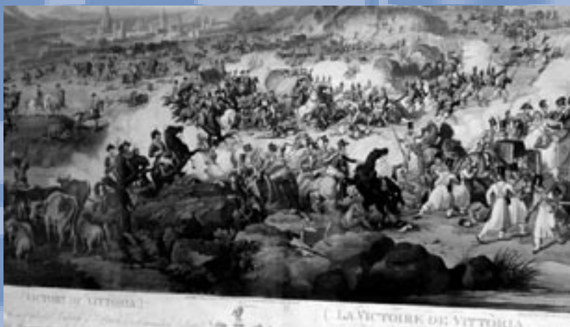
Slag bij Vittoria, 1812

Bij Vittoria versloeg Wellington in 1812 definitief de Fransen in Spanje. Beethovens slagveldevotatie, waarin het Britse 'Rule Britannia' vecht met het Franse 'Marlborough s'en va-t-en guerre' werd voor het eerst in december 1813 uitgevoerd, een benefiet voor invalide veteranen. Maar zijn grootste populariteit beleefde het werk in april 1814, toen het in Wenen voor uitverkochte zalen werd uitgevoerd. Een paar weken eerder had Napoleon in Fontainebleau afstand van de troon gedaan en was hij met de duizend gardesoldaten die hij mocht houden naar Elba vertrokken. Zo vierden de Weners het eind van de Napoleontische oorlogen. Toch ligt Beethovens politieke betekenis niet in zulke stukken. Als geen ander in zijn tijd gaf hij in zijn muziek uitdrukking aan de verandering van wereldbeeld die de kern van de Franse Revolutie vormt: het opgeven van een cyclische opvatting van tijd en maatschappij ten gunste van een waarin onophoudelijke verandering geldt als de normale gang van zaken.