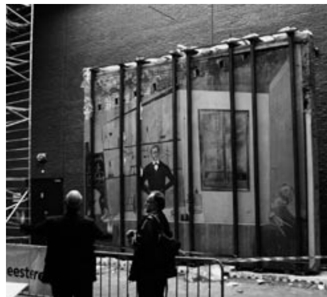
Henkes, kantine Nerefco