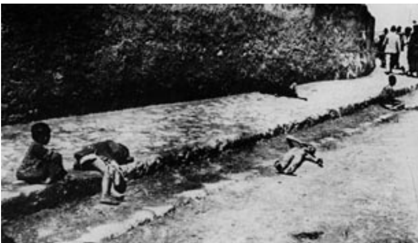
Achtergelaten kinderen van Armeense gedeporteerden (collectie Armin T. Wegner) Informations- und Dokumentationszentrum Armenien te Berlijn.