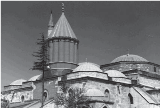
Mevlana-museum in Konya