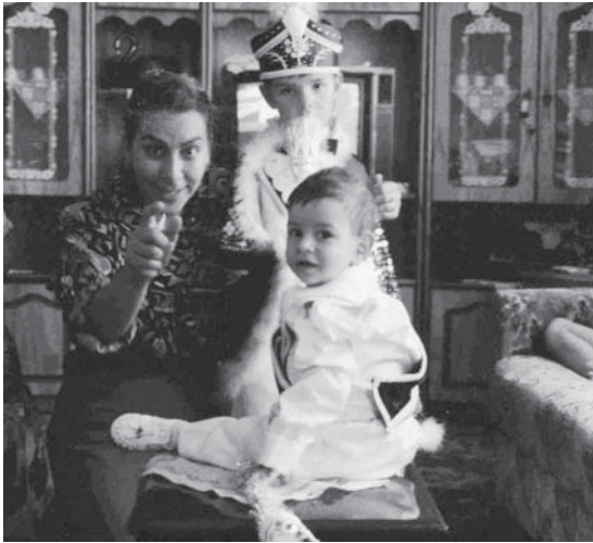
Moeder met zoons in feestkleding vanwege hun besnijdenis

in een soort NSB-positie terecht waren gekomen, geregeld. Van een eigen staat voor Koerden was geen sprake meer. De Armeense droom vervloog al in de vrede tussen Turkije en Rusland.