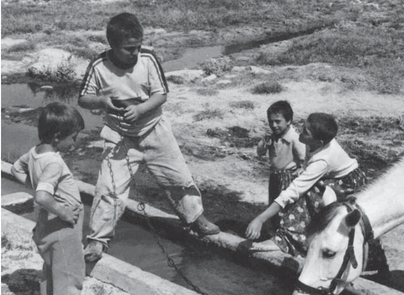
Plattelandstafereeltje nabij aksaray

een geprivilegieerde basis voor de legitimiteit van datzelfde seculiere regime.