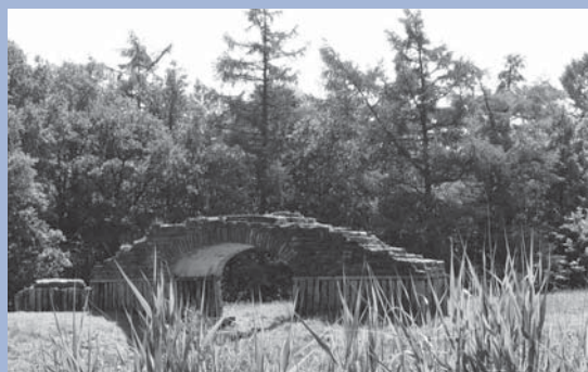
Gereconstrueerde 'spaarboog' op houten funderingspalen van de Kuinder burcht.

De sites van beide kastelen zijn sinds 1978 archeologisch monument, maar alleen van Kuinre I is voor het publiek iets te zien. Niet in de wijde ruimte van waaruit zo'n burcht de vaarwegen beheerste, maar in het Kuinderbos dat Staatsbosbeheer in 1948 heeft gepland, waarbij de omtrek van de burcht met landschappelijke middelen is gemarkeerd. In 1988 werd in overleg met de provinciale archeoloog van Flevoland een deel van het fundament bovengronds herbouwd.