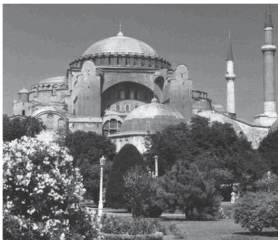
Aya Sofya in Istanbul