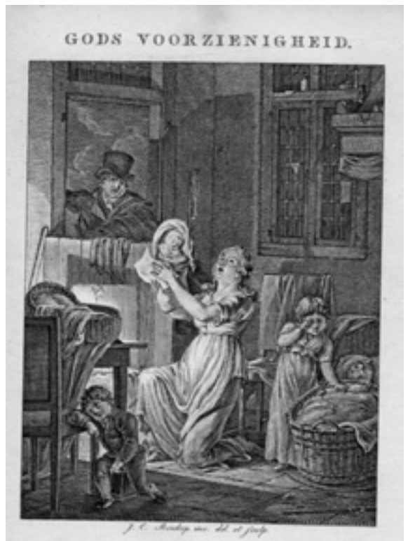
Afb. 3: J.L. Nierstrasz, Jr., ‘Gods voorzienigheid’, in: Nederlandsch Muzen-almanak (1820), pp.152-159.