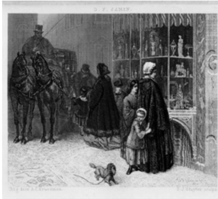
Afb. 1: S.J. van den Bergh, 'Rijken en armen', in: Aurora, 1863, pp. 206-207.

Doet wél, gezegenden op aard! Doet wél naar 't heilig Woord des Heeren: Uw rijkdom zijt gij dubbel waard, Als go u een beetren schat vergaart, Dien nimmer roost noch mot verteeren. — Zoo niet de liefde uw ziel doordringt, Zijt ge arm, spijt al uw heerlijkheden! 't Genot, dat voor uw voet ontspringt, Het goud, dat in uw zalen blinkt, De bonte pracht, waarmee go uw leden Zoo weeldrig dag aan dag omringt, — 't Wordt niets of fletsch, wanneer uw harte, Dat haadt in weelde, gloed en licht, Zich niet ontsluit voor 's armen smarte,