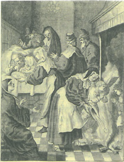
Regis morbi per tormentum, Dum nil sacrum qui circumstant Quod accepit Sacramentum Velent statim flammis mandant! Reperit per vomitum. Quicquid erat redditum. f. 38

Het uitbraken van de hostie die daarna in het vuur geworpen wordt, afbeelding uit 1639