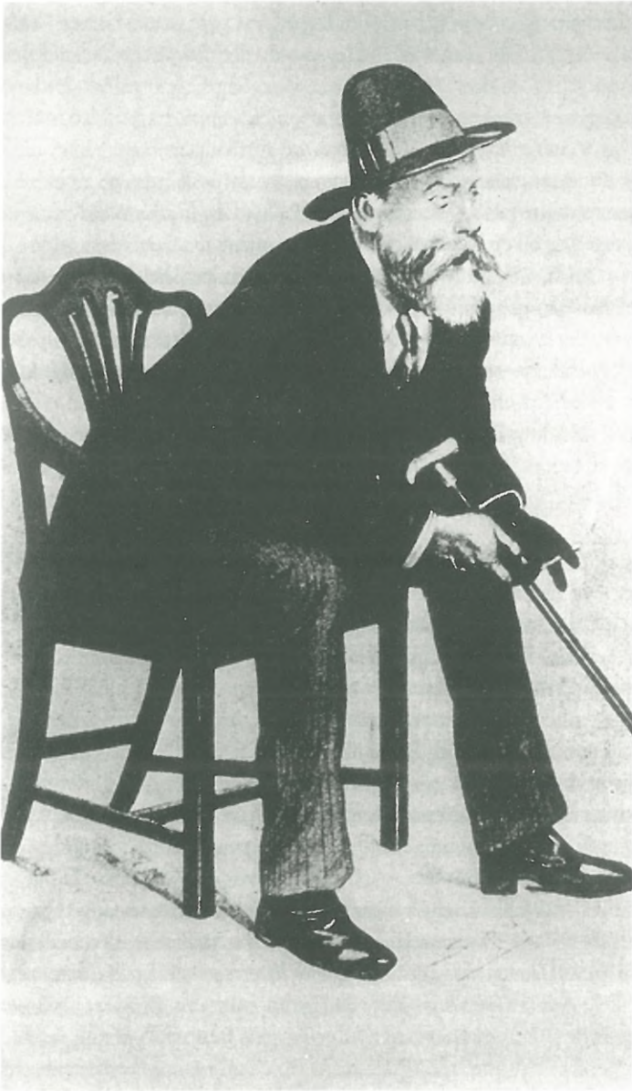
William Ernest Henley.