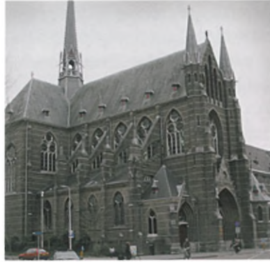
| Dominicanenkerk en -klooster te Zwolle

*Orde, in 1216 gesticht door de Spaanse *kanunnik *Dominicus. Doelstelling van deze gemeenschap van *priester-religieuzen was prediking en *zielzorg, beide gegrondvest in gedegen theologische studie. Met deze nieuwe stichting hoopte Dominicus vanuit de gevestigde kaders van de katholieke kerk tegenwicht te bieden tegen buitenkerkelijke, als kettters bestempelde bewegingen van de *katharen, en de *waldenzen. Dominicus koos voor een sobere, mobiele leefwijze, doctrinaire prediking en een persoonsgericht *apostolaat. Op instigatie van paus *Innocentius III vormde Dominicus zijn gemeenschap in 1216 om tot een kloosterorde: Ordo praedicatorum (orde van de predikers), ook wel Ordo fratrum praedicatorum (orde van de predikbroeders, o.p.). Als kloosterregel koos men die van *Augustinus. Zo werd de grondslag voor een 'gemengd' religieus leven gelegd, met actieve, apostolische en beschouwende componenten. De orde wordt gerekend tot de *bedelorden.