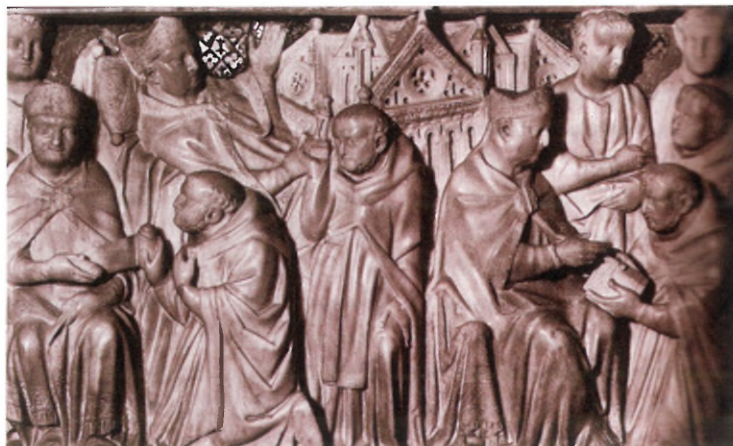
| Een van de reliëfs (Niccolò Pisano 1267) van de grafombe van Dominicus in Bologna. Voorstelling van de goedkeuring van de orde der predikheren door paus Honorius III, waarin drie gebeurtenissen in één tafereel zijn verenigd. Links: Dominicus biedt zijn ontwerp aan de paus aan. Midden achter: de paus ziet in een visioen de dreigende ineenstorting van de kerk, waarvan de muren door Dominicus worden ondersteund. Rechts: de paus overhandigt Dominicus de bul van goedkeuring

1848, werd het predikantschap vooral een binnenkerkelijk ambt. Het kreeg er in de loop van de tijd een aantal taken bij, zoals het godsdienstondericht of *catechese, het individuele *pastoraat, de *liturgie en *gemeenteopbouw. Zo groeide het ambt uit tot het beruchte 'schaap met vijf poten'.