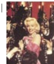
8b Marilyn Monroe zingt 'Diamonds are a girl's best friend', uit Gentlemen Prefer Blondes , 1953.