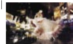
6 Still uit televisiereclame voor Chanel no 5, 2005, (regie Baz Luhrmann), met Nicole Kidman in de hoofdrol.