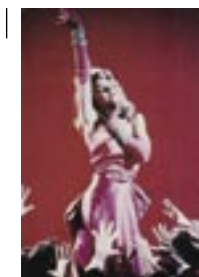
8a Still uit Madonna's videoclip Material Girl uit 1984, waarin zij een pastiche opvoert van Marilyn Monroe's lied 'Diamonds are a girl's best friend' uit Gentlemen Prefer Blondes , 1953.