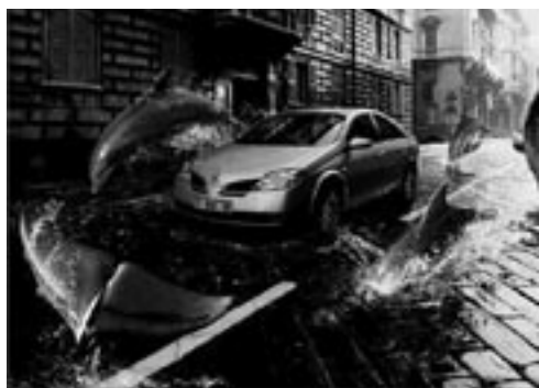
9 Still uit televisiereclame van Nissan, 2002.