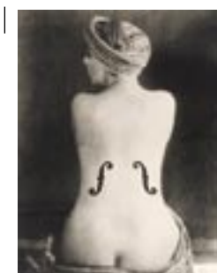
1 Man Ray, Le Violin D'Ingres , 1924.