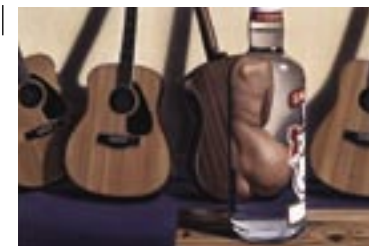
3 Still uit televisiereclame van Smirnoff, jaartal onbekend.