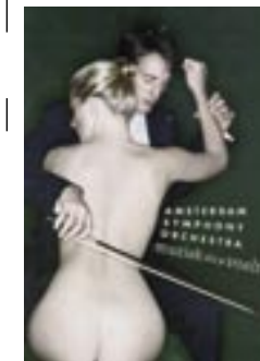
4 Affiche met aankondiging voor het Amsterdam Symphony Orchestra, 2005.