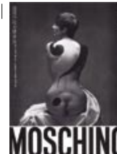
2 Reclamefoto van Moschino, jaartal onbekend.