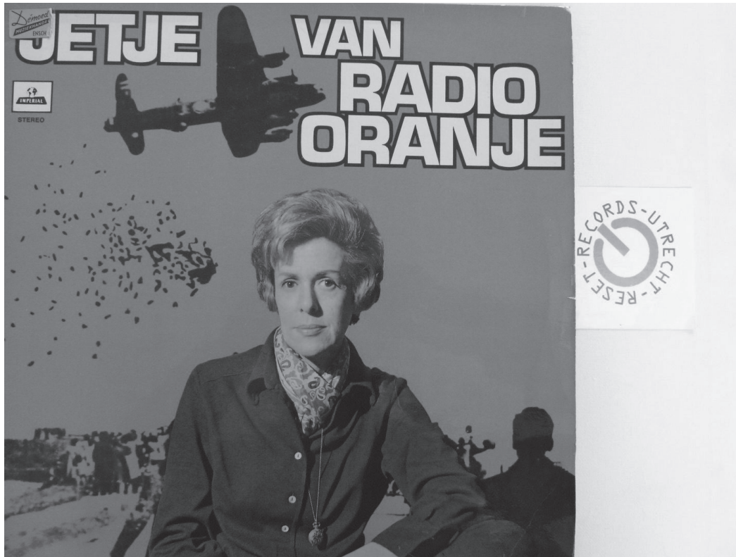
Albumhoes LP Jetje van Radio Oranje , Imperial, 1970. 11

om de landgenoten in bezet Nederland te bereiken en hen aan te sporen in hun verzet tegen de nazi's. De nieuwsbulletins waren zeker in de eerste jaren vaak achterhaald of onvolledig, maar de toespraken van koningin Wilhelmina speelden een belangrijke rol in de ondersteuning van het moreel van de bevolking. De uitzendingen van De Watergeus (vanaf maart 1941) verspreidden eenzelfde strijdvaardige boodschap, maar op een luchtiger toon.