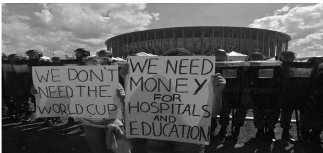
Afbeelding 3: Voor de openingswedstrijd van de Braziliaanse Confederations Cup in de hoofdstad Brasília proberen actievoerders onder zware beveiliging internationale media-aandacht te krijgen voor hun protest tegen het WK.