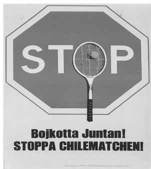
Afbeelding 1: Voor het eerst grepen solidariteitsactivisten op grote schaal sport aan om te protesteren tegen de coup in Chili en de mensenrechtenschendingen door de junta. Hier een Zweedse poster tegen een Daviscupwedstrijd tussen Zweden en Chili (Kjartan Slettemark, poster 60x44 cm, Aktionsgruppen Stoppa Chilematchen, 1975)

gingen met Latijns-Amerika rond mensenrechten in de loop van de jaren 1970. Zoals hoe na de coup van 1973 in Chili enkele honderden Chileenen in ballingschap en solidariteitsactivisten een wedstrijd van Chili op het WK van 1974 in West-Duitsland aangrepen om zich met spandoeken en leuzen te verzetten tegen de staatsgreep en repressie van het nieuwe bewind. 19 Activisten gingen de aandacht voor sport benutten om de mensenrechtenschendingen van autoritaire staten op de agenda te zetten zoals bij de Daviscupfinale in Chili (1976), een internationaal voetbaltoernooi in Uruguay (1980) en bij het WK Voetbal in Argentinië (1978).