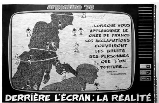
Afbeelding 2: Een protestposter van het Franse boycotcomité laat zien dat achter de voetbalwerkelijkheid een andere schuil gaat en koppelt hier heel expliciet de martelingen door de junta aan met een citaat van Amnesty International: 'Als u applaudisseert voor het Franse elftal, overstemt het gejuich het geluid van gemartelde mensen.'