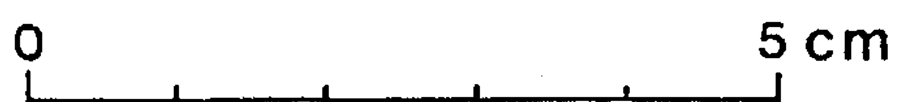
Afb. 1-3. Fragment van een terracotta voorwerp uit Eindhoven (naar believen te keren). Schaal 1 : 1. tek. h.J. Ponten, Nijmegen.